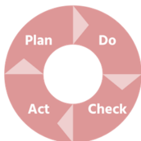
Figuur 3: Kwaliteitscyclus

Via een kwaliteitscyclus VVE werken we toe aan het systematisch evalueren en verbeteren van de VVE op gemeentelijk niveau. Als gemeente voeren we dit VVE-beleid uit volgens de beleidscyclus. Om de beleidsdoelen te halen, zijn afspraken gemaakt met de GGD, VVE-aanbieders, bibliotheek en basisscholen. Het maken van de afspraken, deze monitoren en evalueren is de kwaliteitscyclus. De kwaliteitscyclus heeft tot doel om de uitvoering en kwaliteit van VVE te monitoren en te evalueren en tegelijkertijd inzicht te bieden in de voortgang van de beleidsdoelen. We gebruiken hierbij de PDCA cyclus, de Plan-Do-Check-Act cyclus.