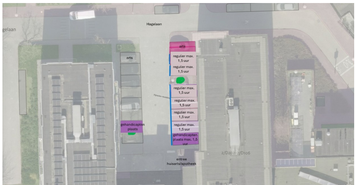
Afbeelding 1: nieuwe situatie aan de Hagelaan 1, (tijdelijk) toe te passen blauwe zone en (definitief) wijzigen in locatie artsenplekken en één algemene gehandicaptenparkeerplaats

Eén en ander zoals aangegeven in afbeeldingen 1 en 2