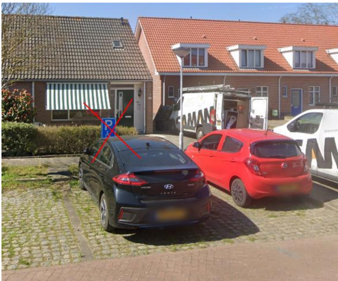
Afbeeldingen in verkeersbesluit behorende bij zaaknummer 1697763 d.d. 22-04-2026