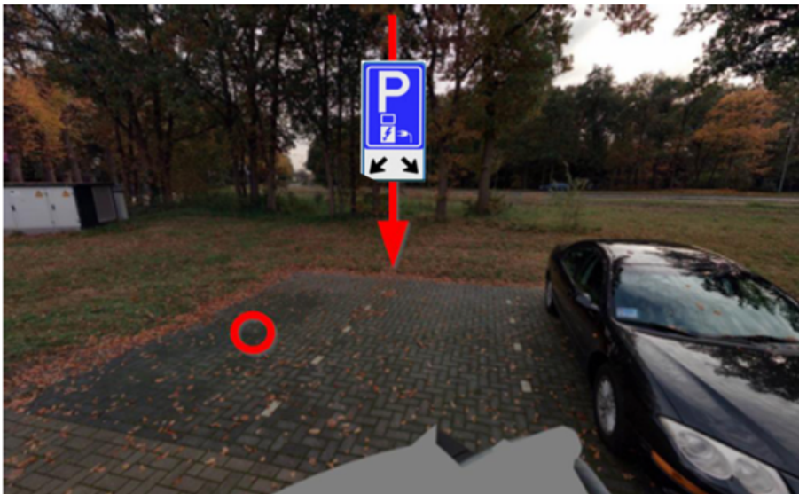
Locatie Anthonie Duyckplein t.h.v. no. 10 2242 TT Wassenaar.