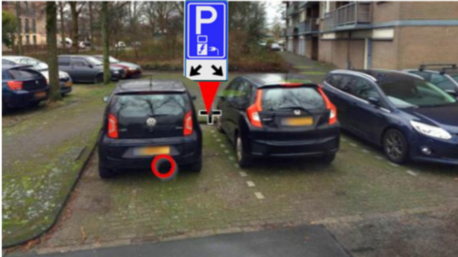
Locatie Papeweg t.h.v. no. 1 2245 AD Wassenaar