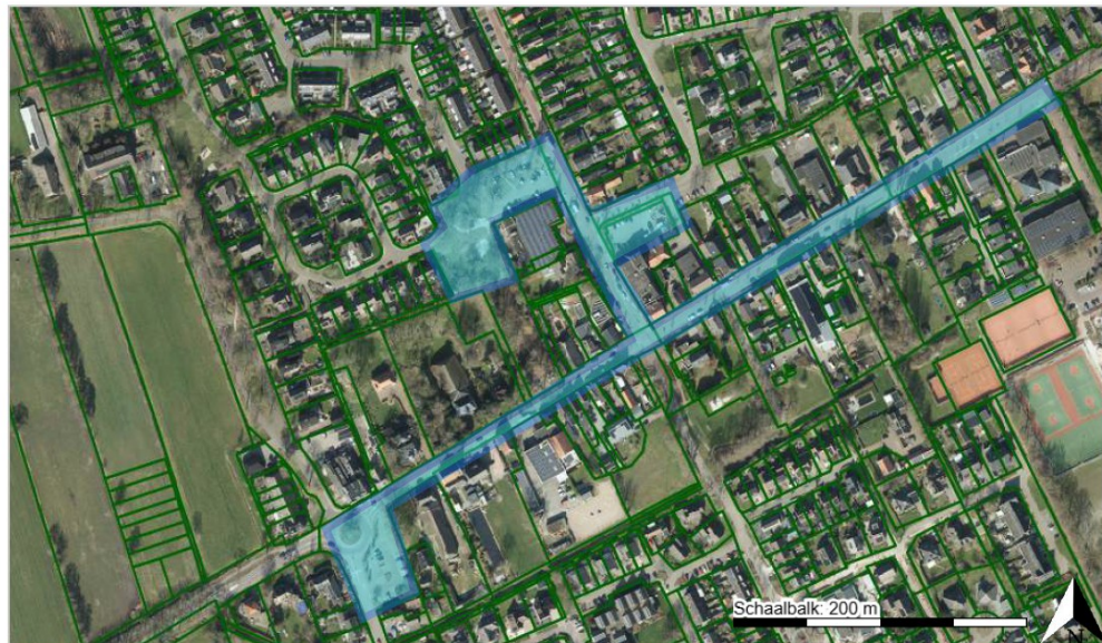
Alcoholverbodsgebied artikel 2:48 APV Ruinerwold