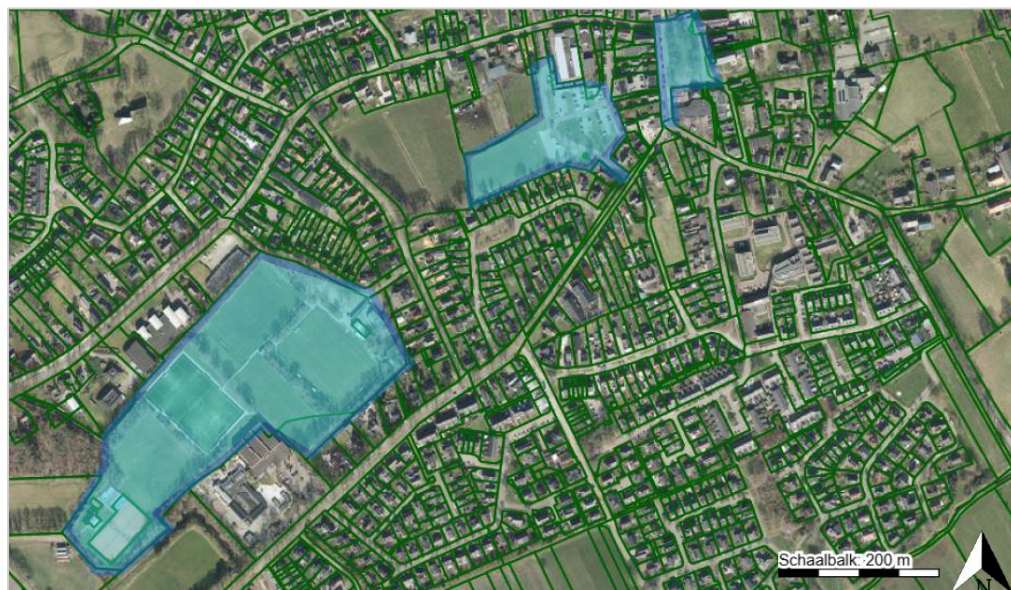
Alcoholverbodsgebied artikel 2:48 APV Ruinen