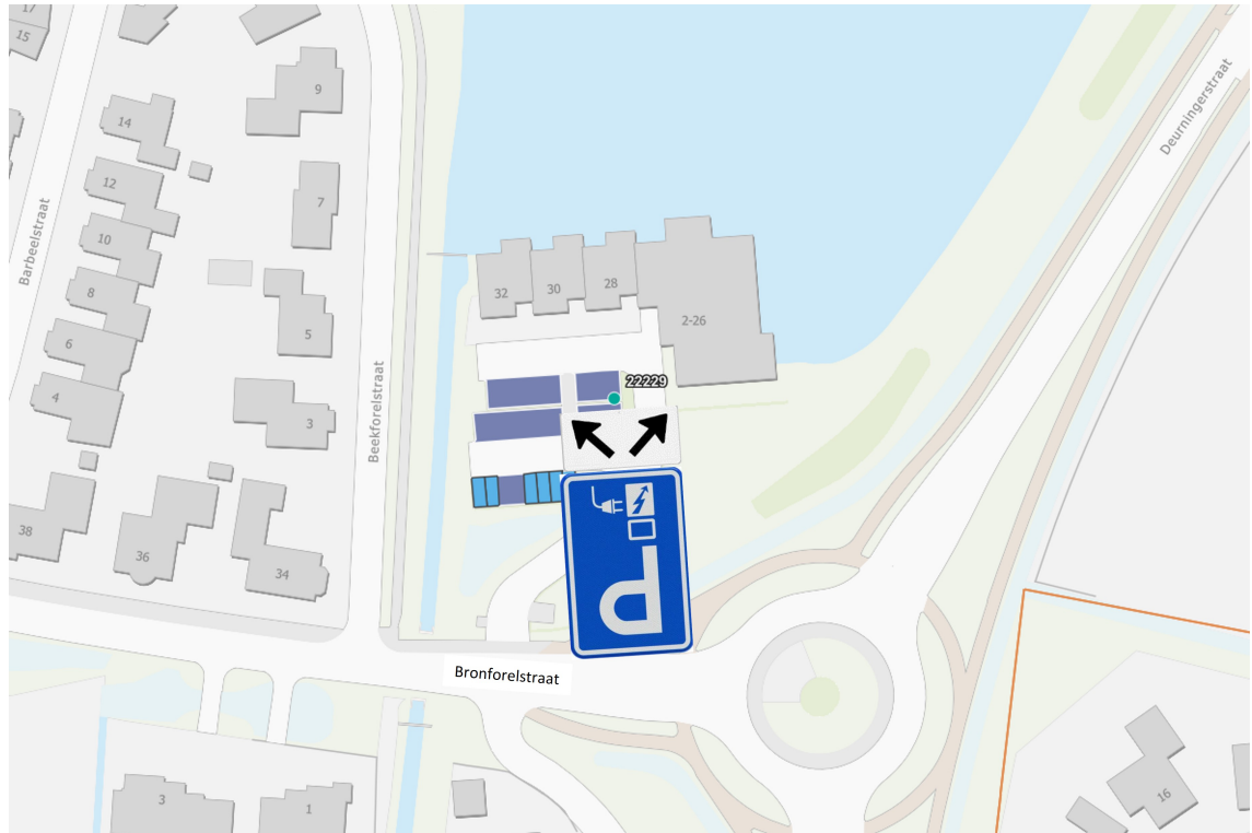
Locatie laadpaal Bronforelstraat