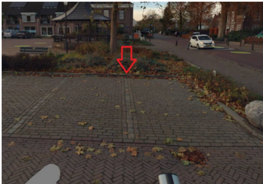
2. Boterbloem 30 te Boxmeer: