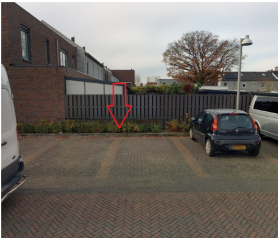
13. Regiment Stoottroepenstraat 4 te Cuijk: