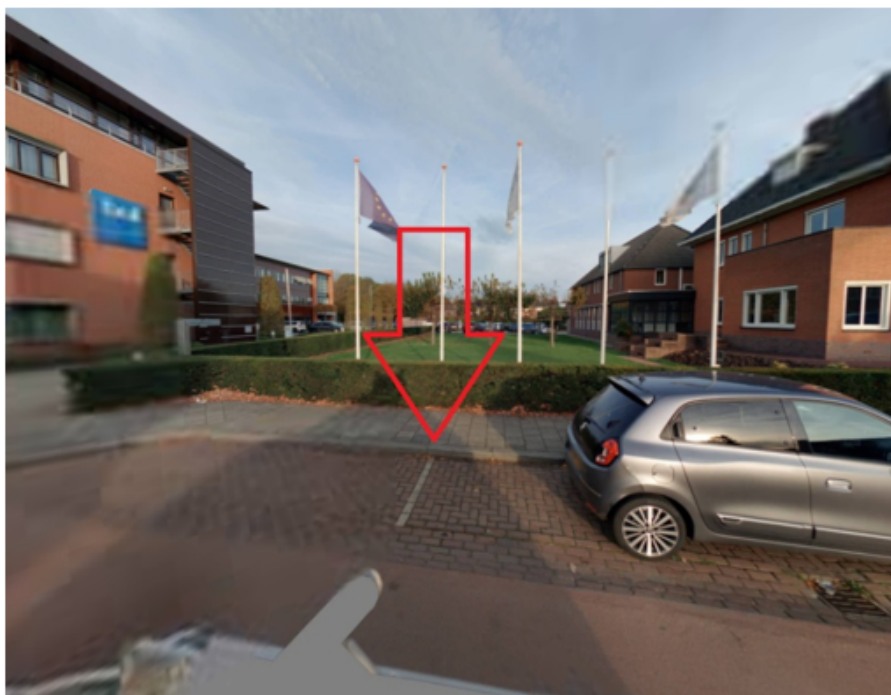
7. Fazantenveld 50 te Cuijk: