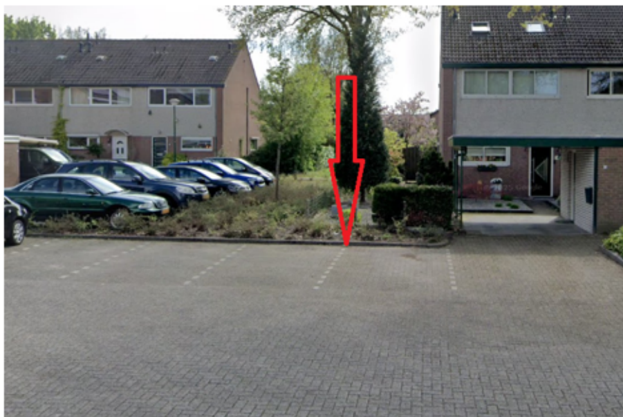
19. Stadhouderslaan 17 te Grave: