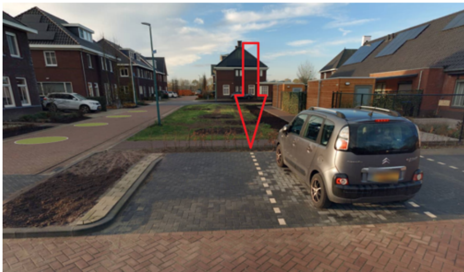
24. Bakhuisweg 2a te Mill: