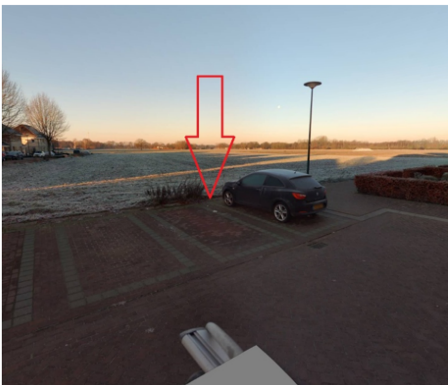
5. Jan Tooropstraat 4 te Boxmeer: