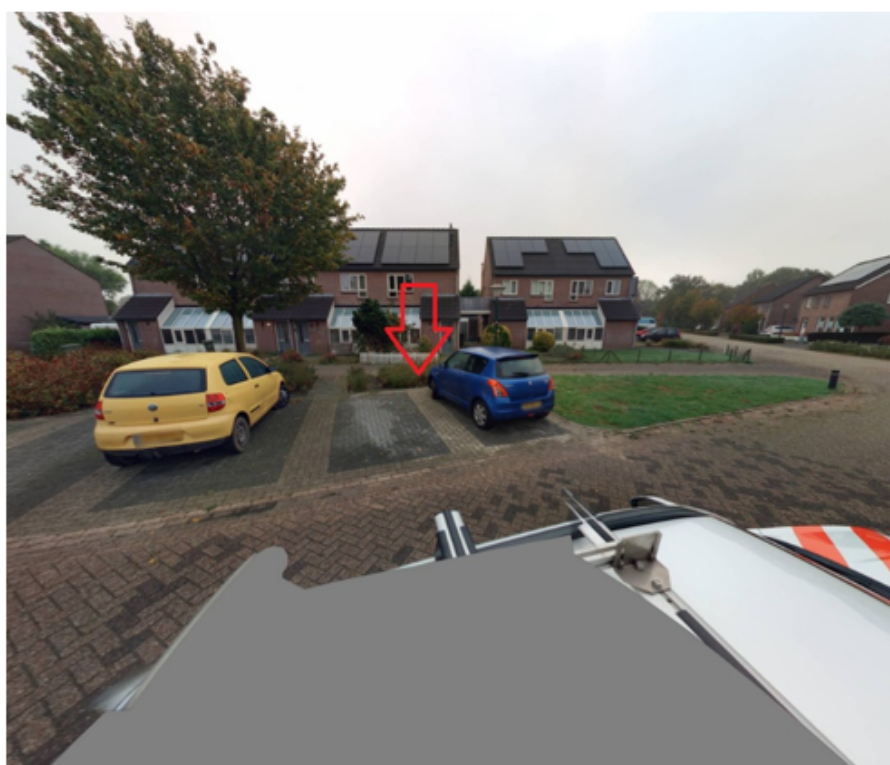
35. Kloosterhof 18 te Vierlingsbeek: