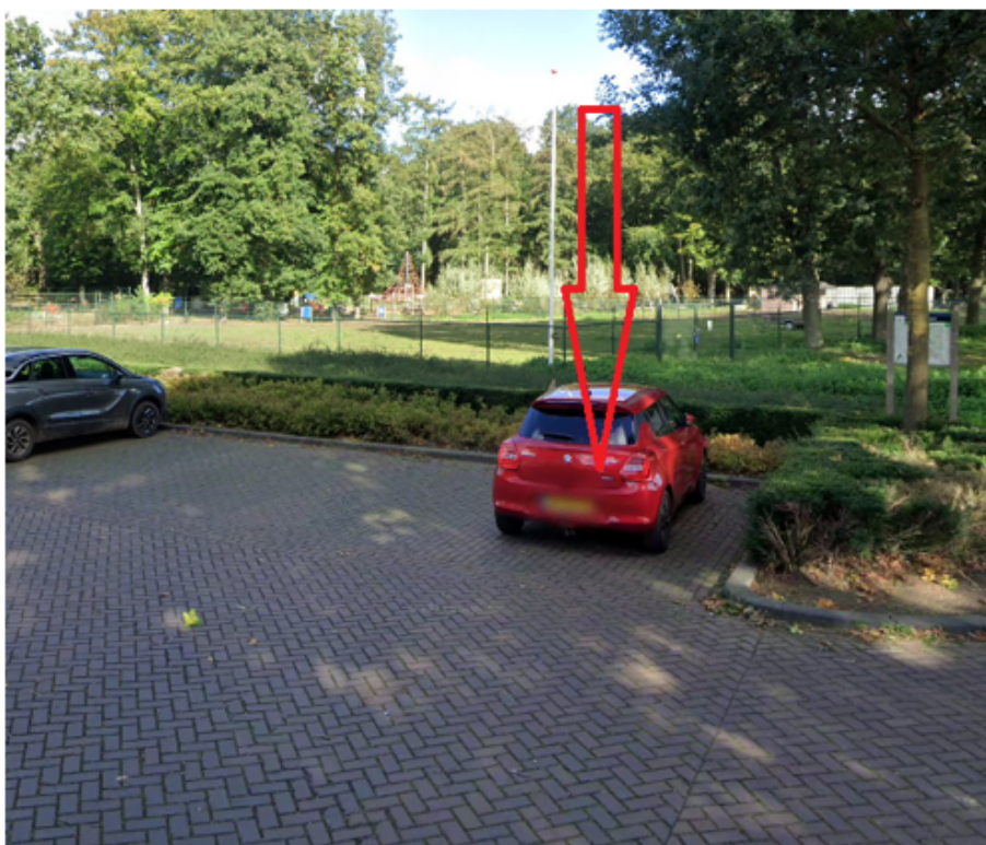
27. Wil van der Burgtstraat 66 Overloon: