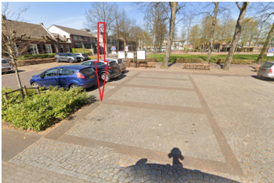
34. Randweg 60 te Sint Anthonis: