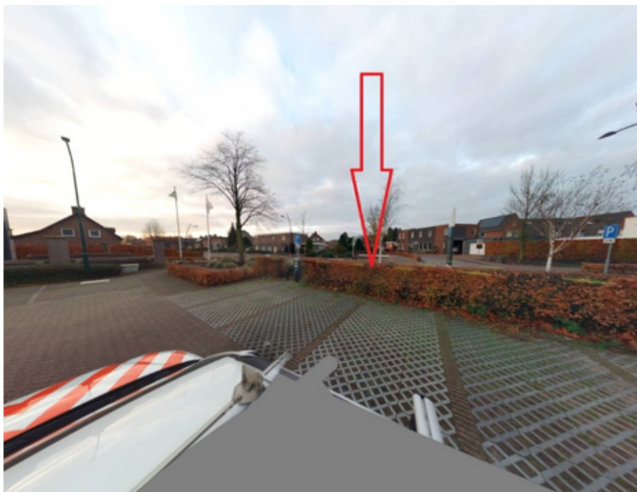
32. De Lange Loop 30 te Sint Anthonis: