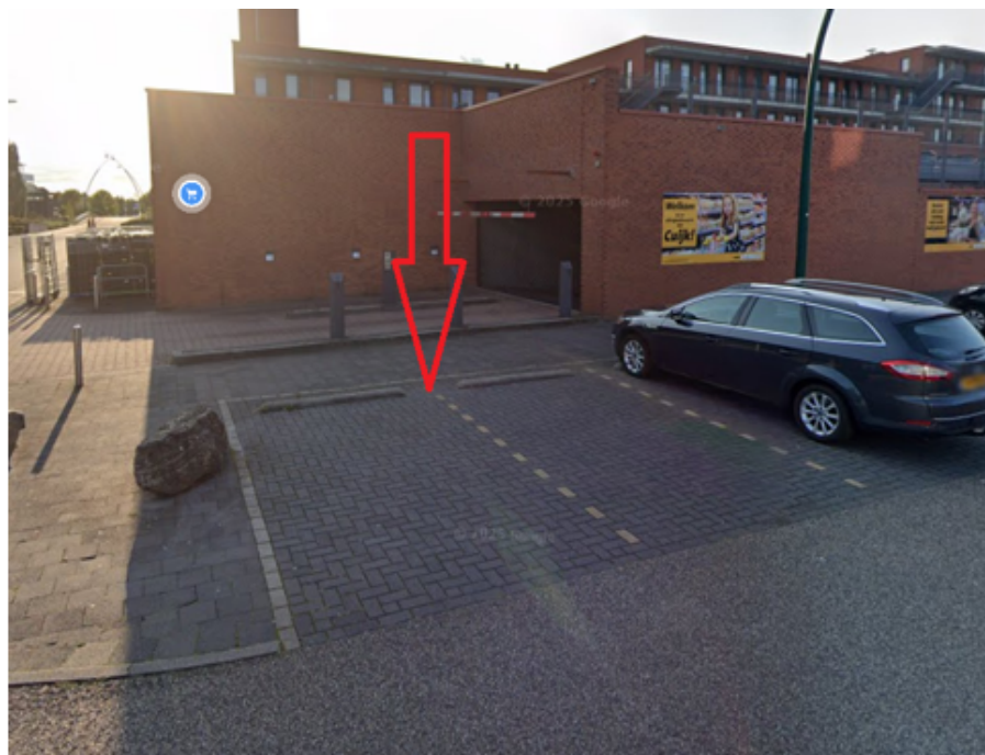
11. Lavendel 369 te Cuijk: