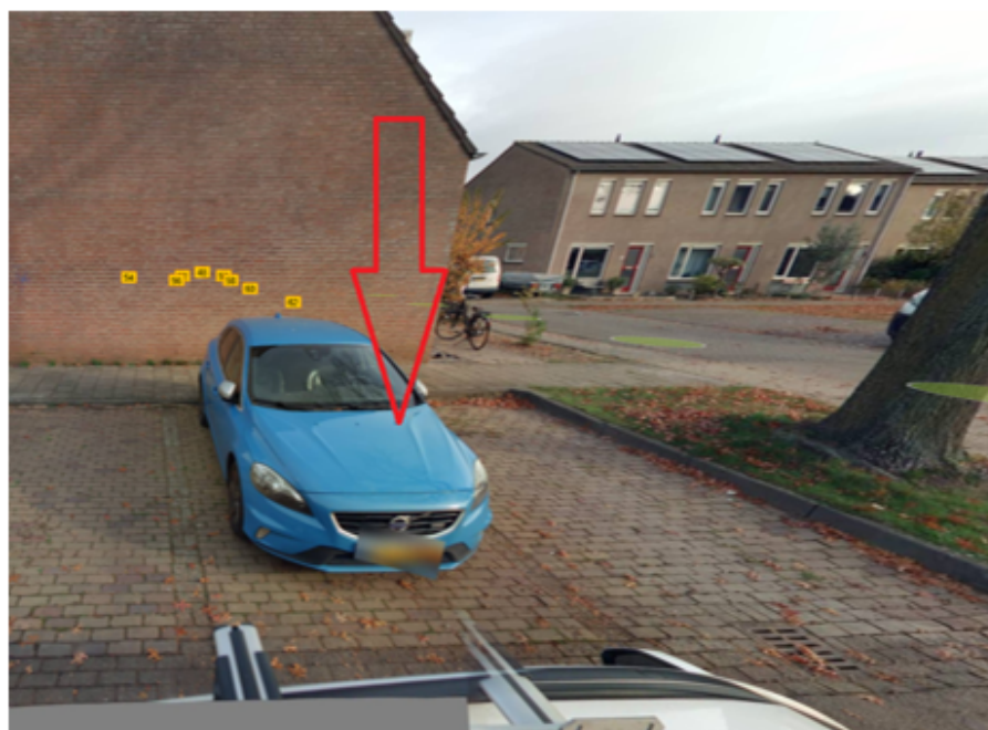
21. Wederik 12 te Grave: