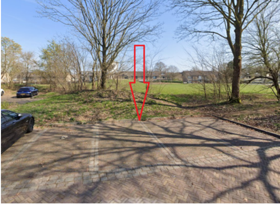
16. Zandberg 6 te Cuijk: