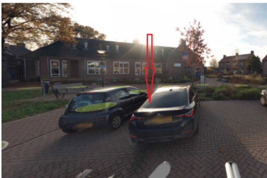
23. Den Akker 7 te Ledeacker: