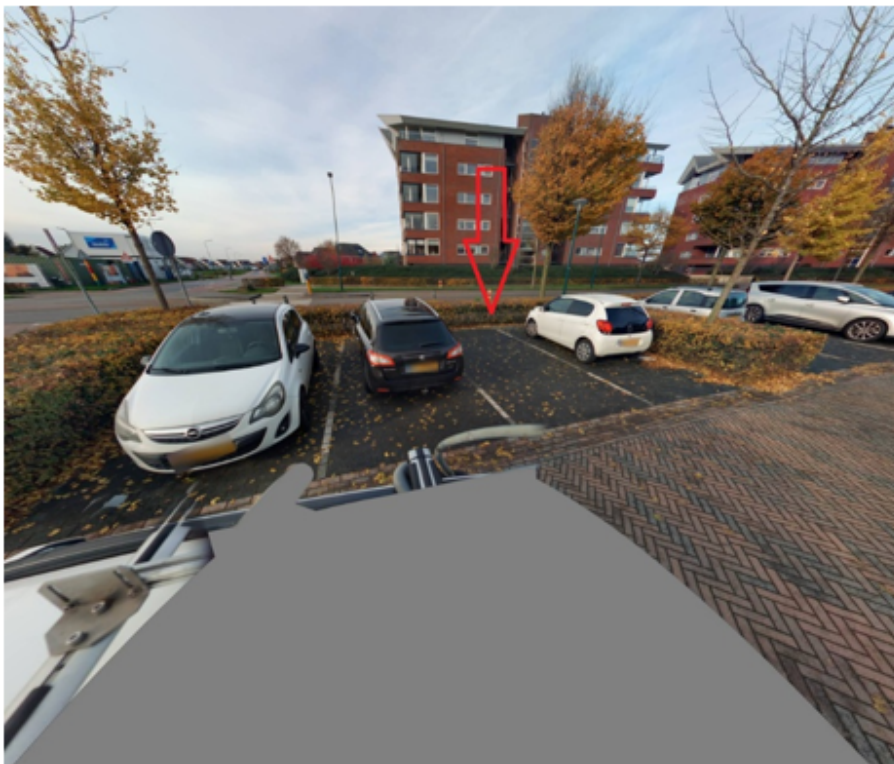
12. Potbeker 23 te Cuijk: