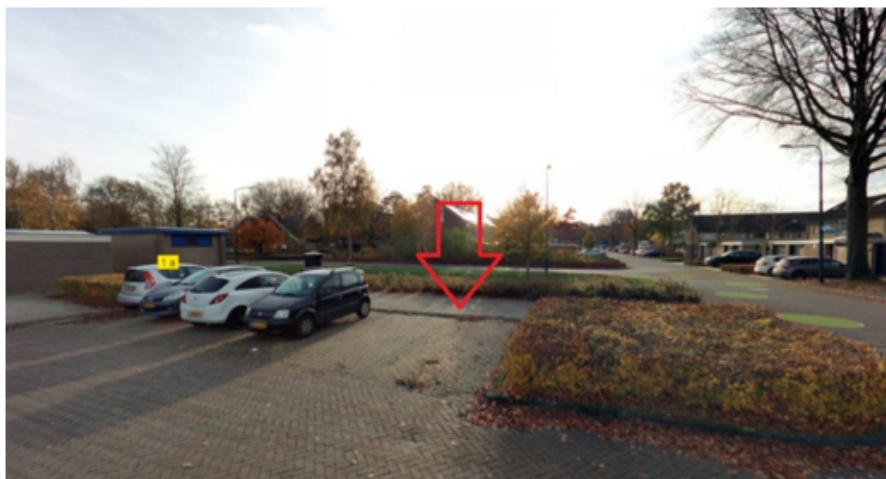
8. Guldengarde 54 te Cuijk: