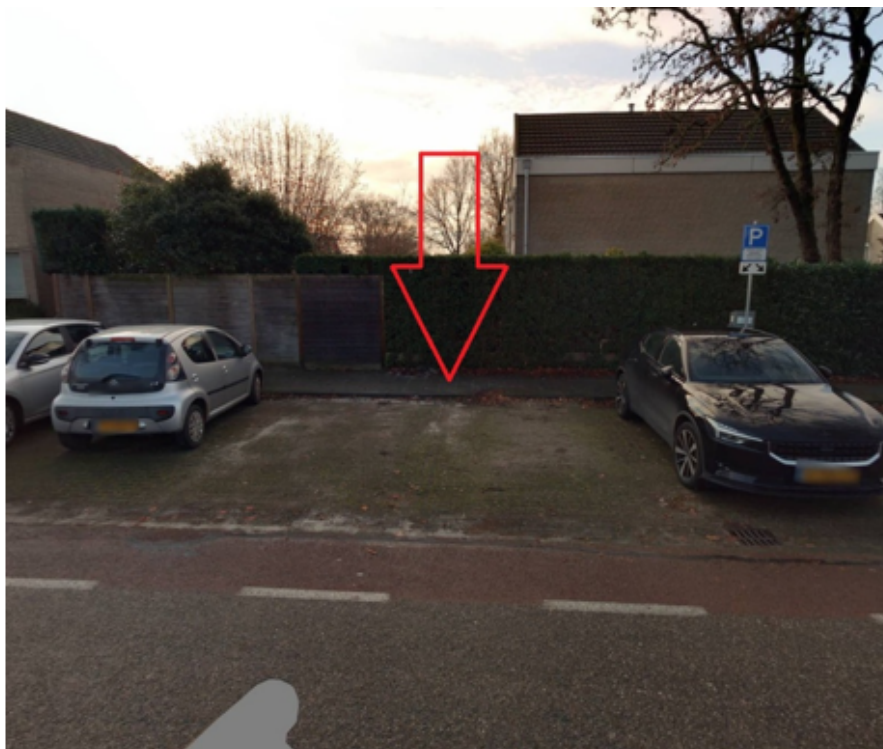
4. Duifkruid 69 te Boxmeer: