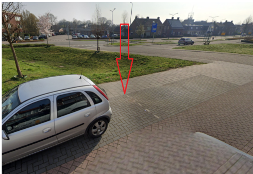
6. Spoorstraat 69 te Boxmeer: