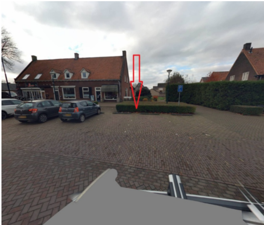
18. Burgemeester Raijmakerslaan 12 te Grave: