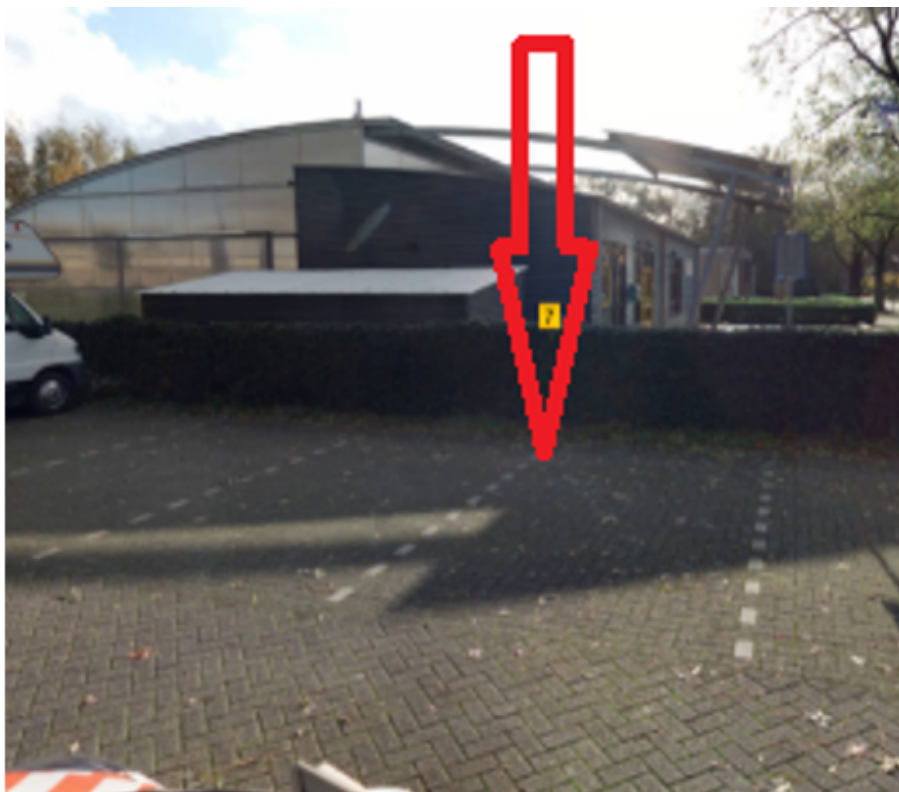
20. Traverse 86 te Grave: