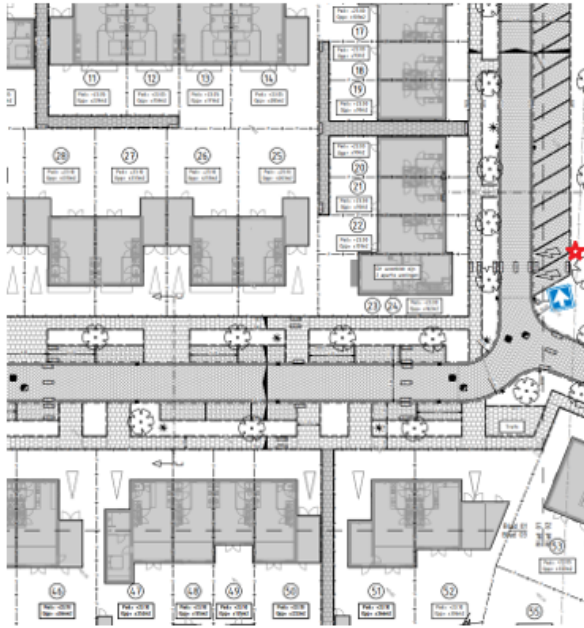
28. Meester van den Bergplein 4 te Rijkevoort (1):