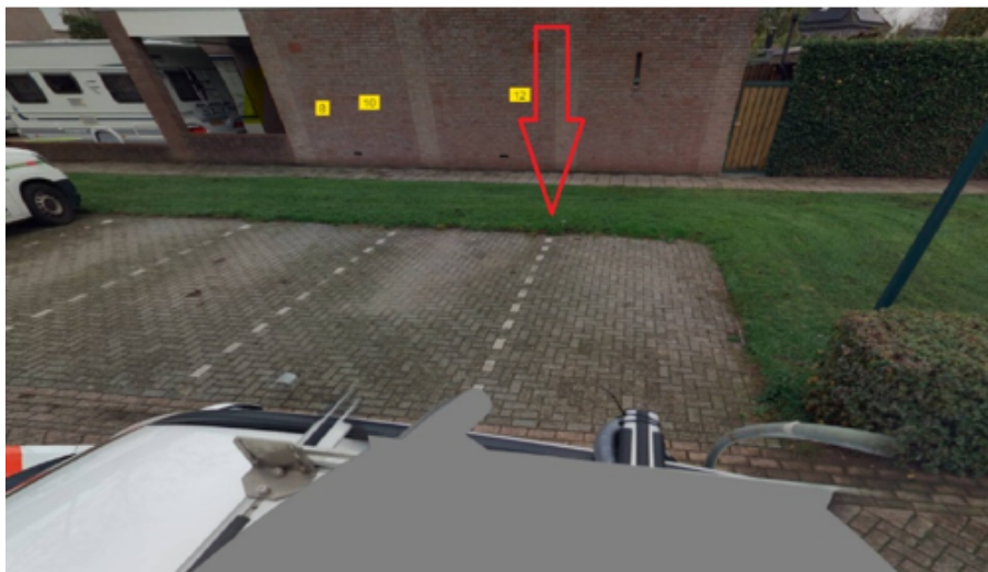
31. Breesstraat 1d te Sint Anthonis: