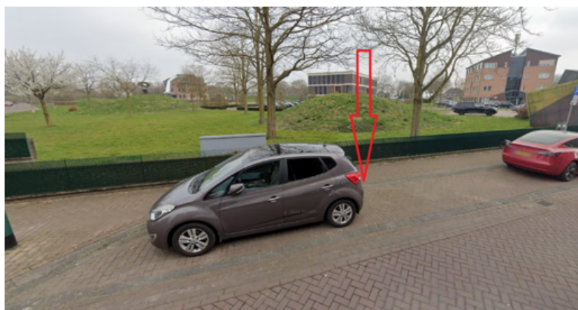
3. De Raetsingel 30 te Boxmeer: