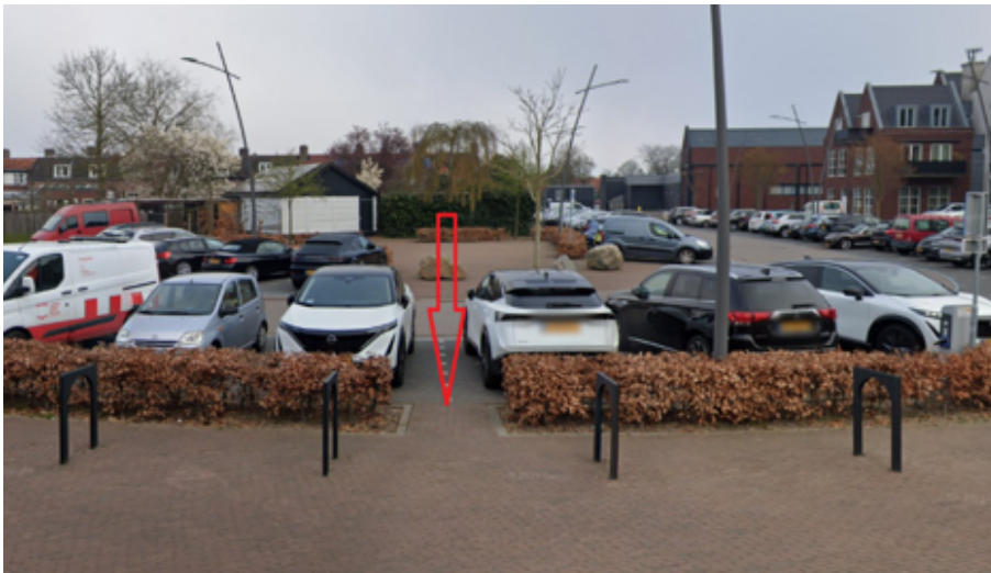
17. Burgemeester de Bourbonplein 3 te Escharen: