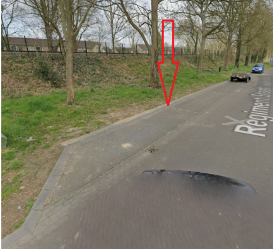
14. Wilhelminastraat 1a te Cuijk: