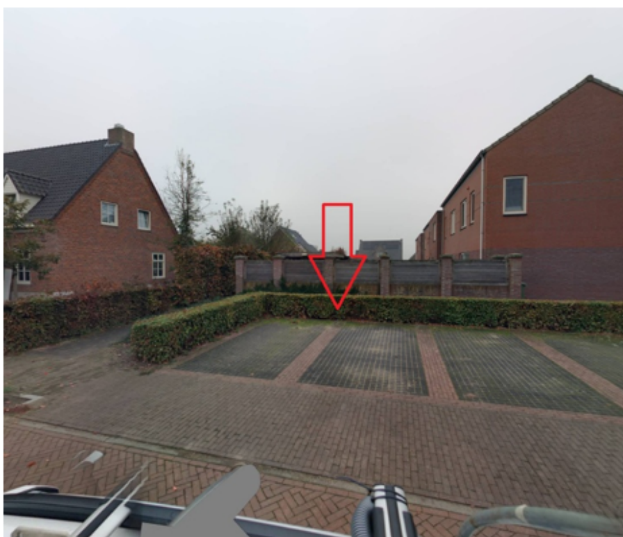
33. Lepelstraat 2 te Sint Anthonis: