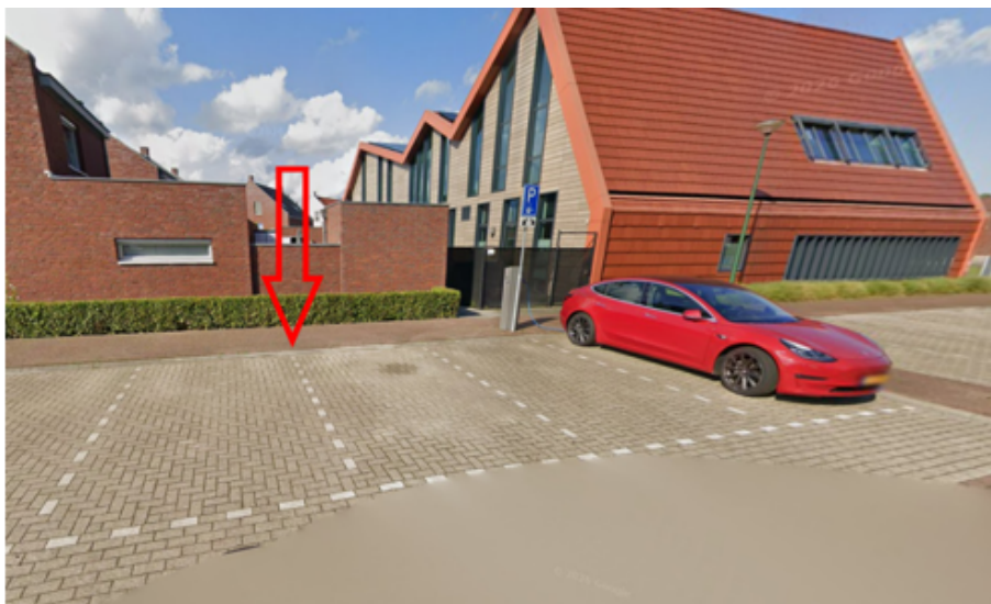
26. Raaijweg 13 te Overloon: