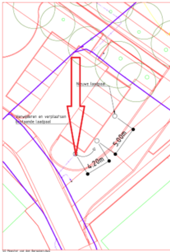
29. Meester van den Bergplein 4 te Rijkevoort (2):