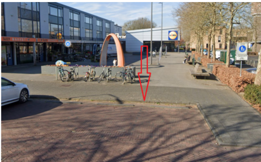
9. Kalmoes 17 te Cuijk: