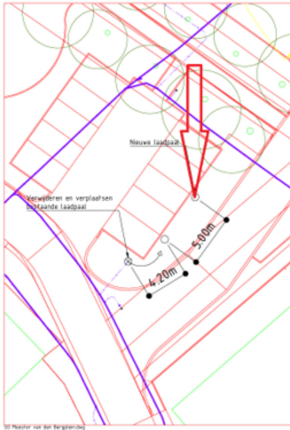
30. Strijdhamer 6 te SambEEK: