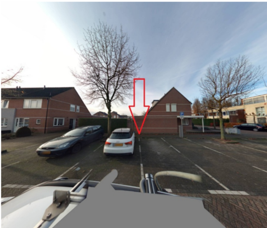
10. Lavendel 238a te Cuijk: