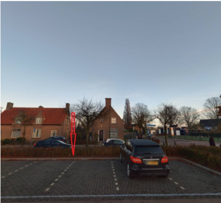
15. Wolfskuil 35 te Cuijk: