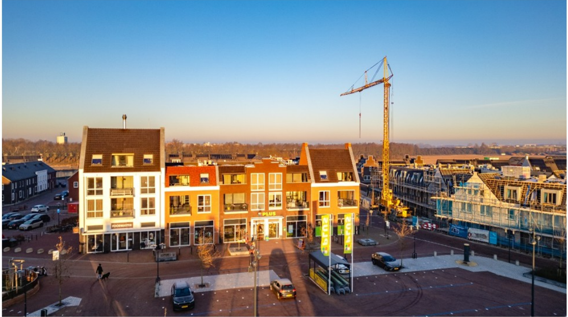
Hoef en Haag