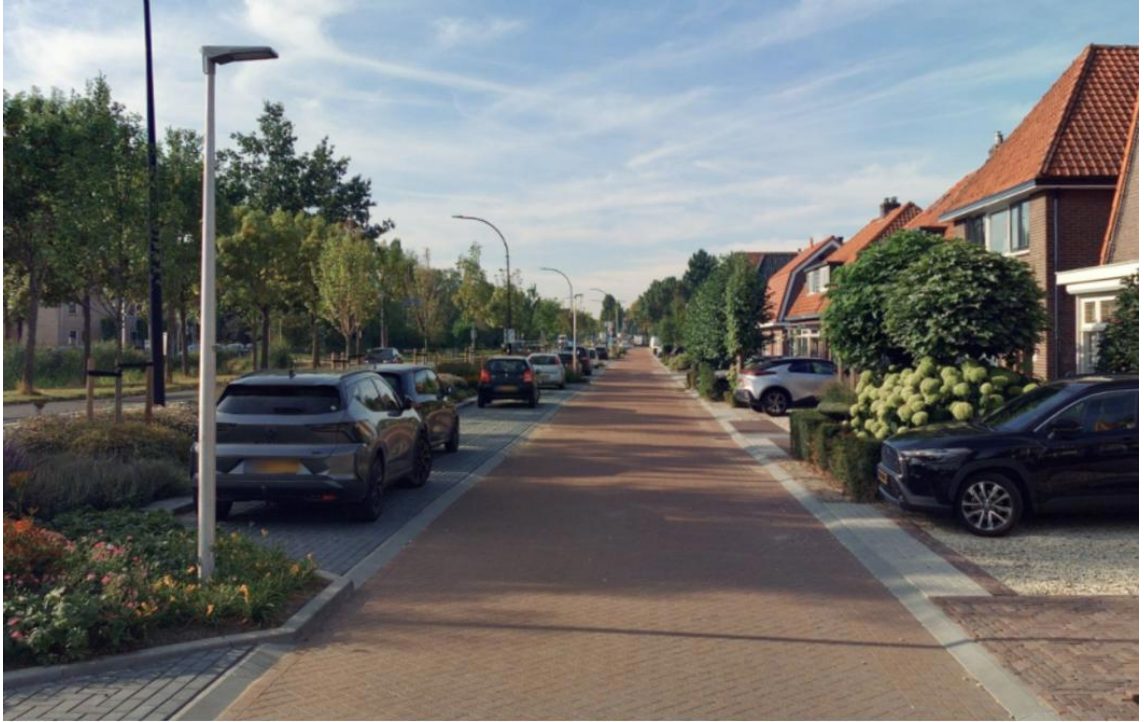
Straatbeeld parallelweg Schaikseweg