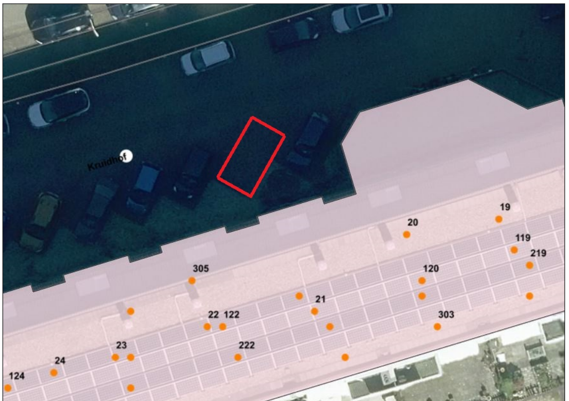
Luchtfoto van locatie aangewezen voor een gehandicaptenparkeerplaats

Burgemeester en wethouders van Hendrik-Ido-Ambacht, 30 maart 2026