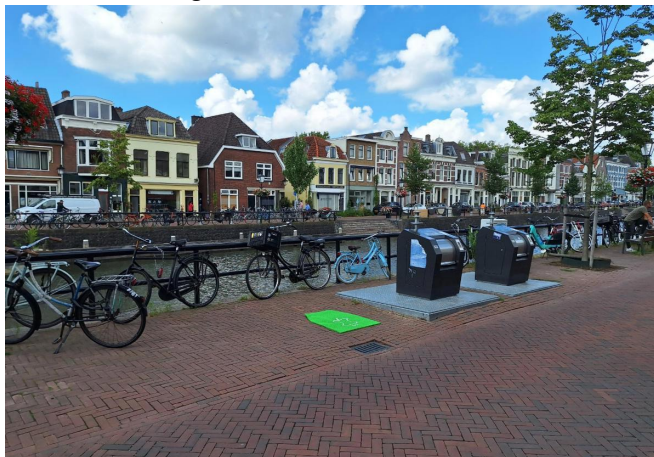
5.40 Oosterkade tegenover nummer 23