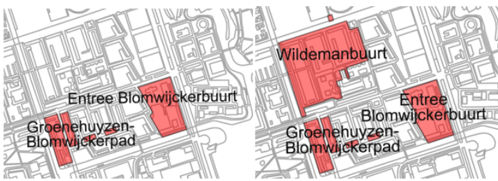
Uitsnede Kaart A Besluit 9 oktober 2025 (oud) Uitsnede kaart A voorliggend besluit (nieuw)