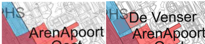
Uitsnede Kaart A Besluit 9 oktober 2025 (oud) Uitsnede kaart A voorliggend besluit (nieuw)