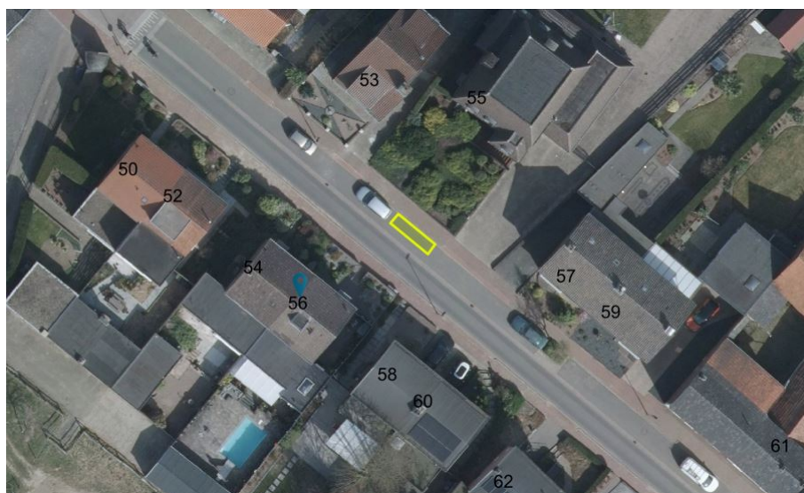
Figuur 2: Locatie GPP Kluisstraat 56, Doenrade