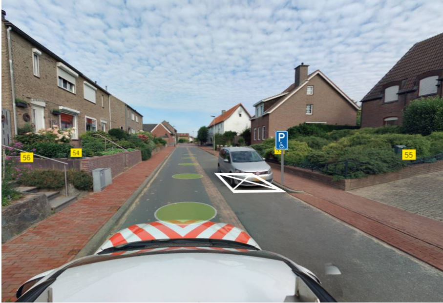
Figuur 3: GPP Kluisstraat t.h.v. nr 56