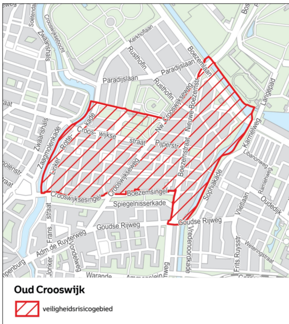
Kaart 2: detailkaart CBS-buurt Oud Crooswijk