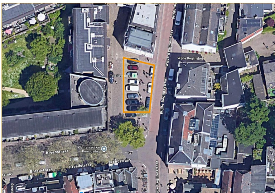
Parkeerplaats Breedstraat/Wijde Begijnestraat;