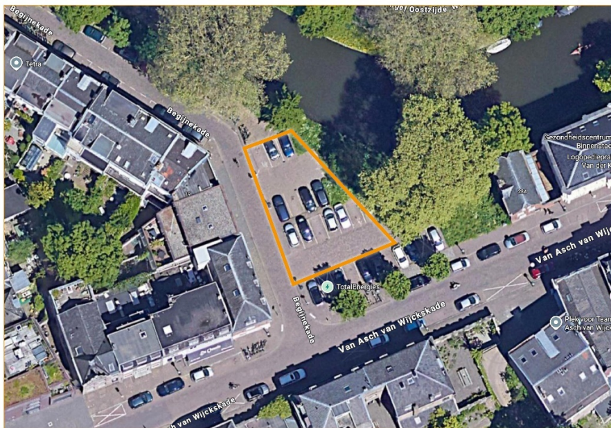
Parkeerplaats Begijnekade/Van Asch van Wijckskade