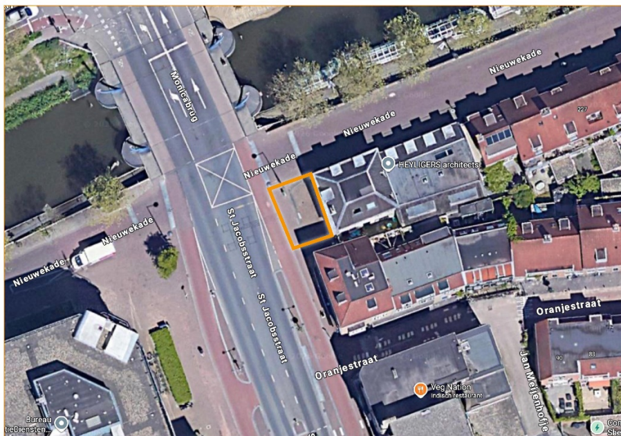
Kruising Nieuwekade/st Jacobsstraat;