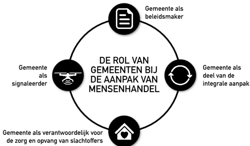
Afbeelding 1: De rol van gemeenten bij de aanpak van mensenhandel volgens de Nationaal Rapporteur

De staatssecretaris van Justitie en Veiligheid stelt naar aanleiding daarvan dat gemeenten een rol hebben op het gebied van preventie, signalering, handhaving en hulpverlening, en bijdragen aan het opwerpen van barrières tegen mensenhandel 4 . In 2018 werd dan ook in het Interbestuurlijk Programma (hierna: IBP) besloten dat elke gemeente in 2022 een duidelijke en geborgde aanpak van mensenhandel moet hebben 5 .