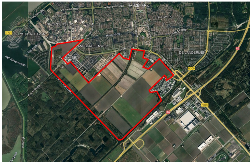
Afbeelding 1: Luchtfoto en globale begrenzing gebiedsontwikkeling Zuiderhage

Deze wijziging van het omgevingsplan maakt de ontwikkeling van de eerste fase (van 2400 woningen) van een nieuw woongebied juridisch-planologisch mogelijk met een divers woonprogramma. Dit nieuwe woongebied is gelegen ligt ten zuiden van Lelystad en wordt begrensd door respectievelijk het bedrijventerrein Noordersluis, woongebied Warande fase 1 en de Larserdreef aan de noordzijde. Deze ontwikkeling sluit aan op door de gemeenteraad van Lelystad op 1 juli 2024 vastgestelde Mastervisie Zuiderhage. Met dit besluit wordt bereikt dat het plan goed onderbouwd is.