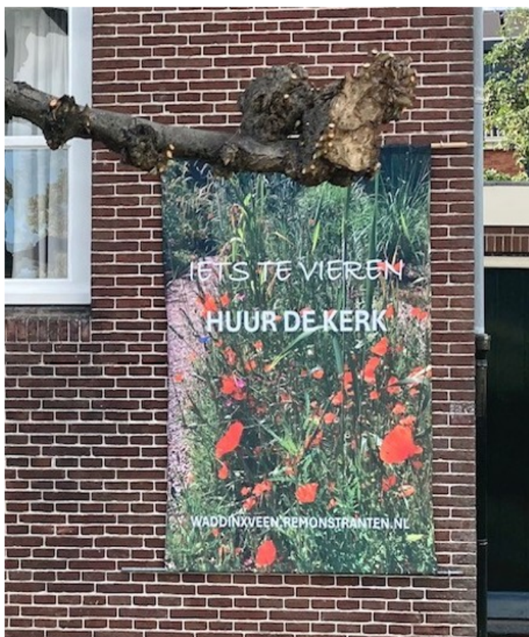
Figuur 1. Doek aan de gevel van de Remonstrantse kerk

Met de Visie voor Gebedshuizen stimuleert de gemeente het multifunctioneel gebruik van gebedshuizen. Dit wordt ook opgenomen in het Omgevingsplan van Waddinxveen, waarin bij de geldende functies meer ruimte geboden zal worden voor het multifunctioneel gebruik. Zo zal multifunctionaliteit ook planologisch gezien, naast opgesteld beleid, toereikend zijn voor de gebedshuizen.