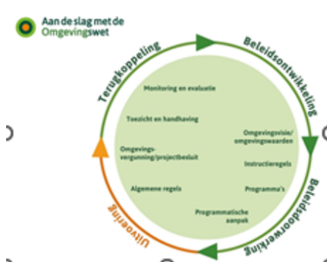
Figuur 3: Beleidscyclus Omgevingswet

In de geest van de Omgevingswet gaat het erom dat de leefomgeving op een integrale manier wordt bestuurd met het oog op duurzame ontwikkeling, bewoonbaarheid van het land en verbetering van het leefmilieu. Dit vraagt samenhang tussen het beleid, de regels en de uitvoering. Deze samenhang wordt verbeeld door een gesloten beleidscyclus.