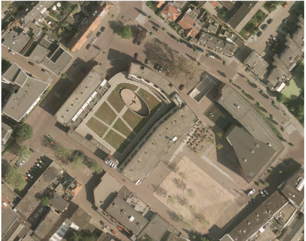
Figuur 2 Luchtfoto Centrum (Raadhuisplein e.o.)