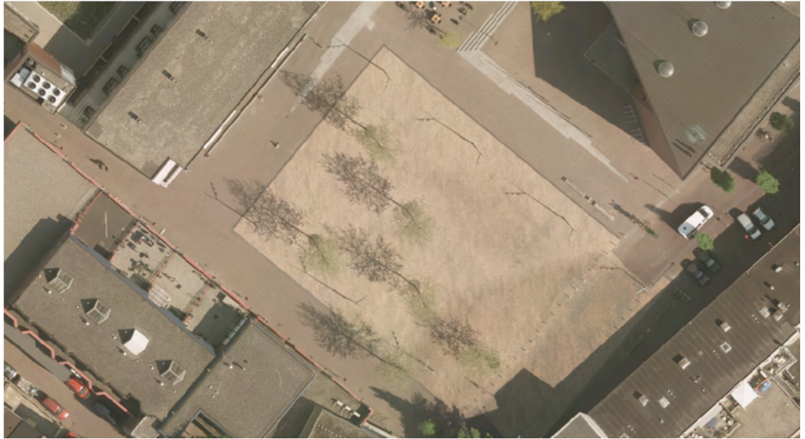
Figuur 1 Luchtfoto Raadhuisplein