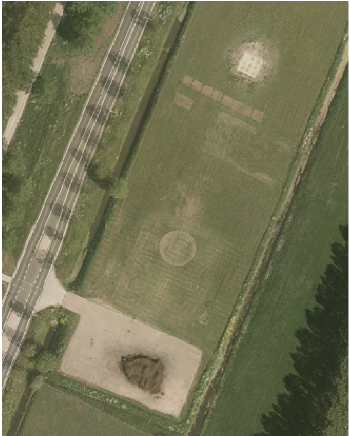
Figuur 3 Luchtfoto Evenemententerrein