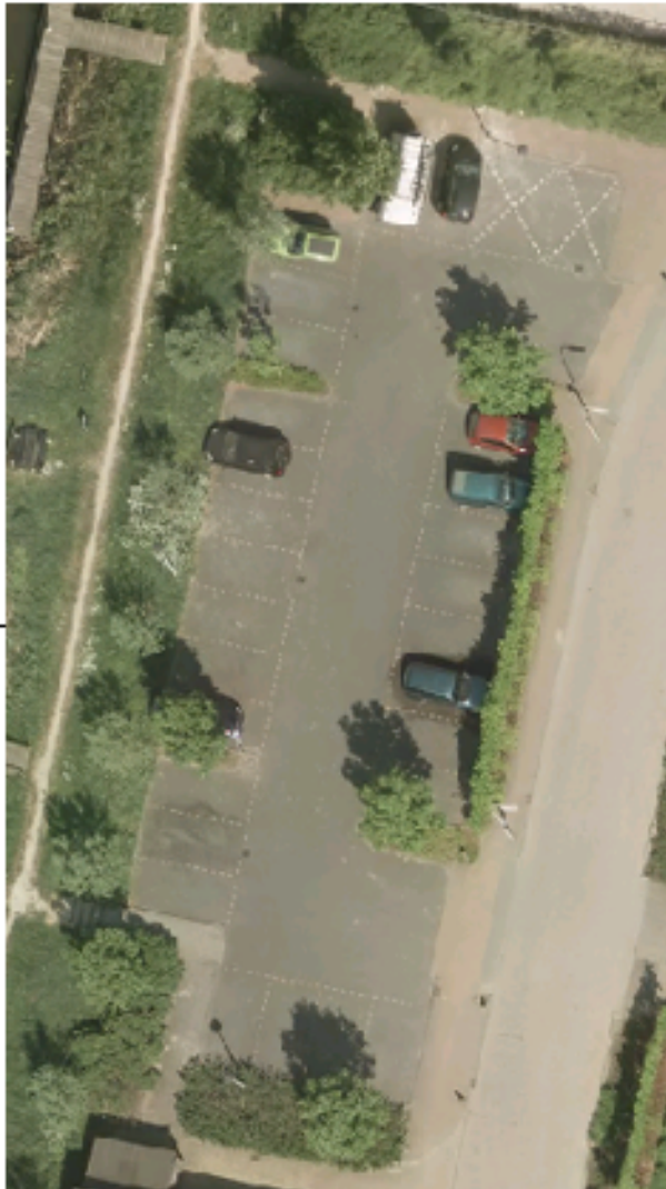
Figuur 6 Luchtfoto Parkeerterrein Gr. Albrechtstraat