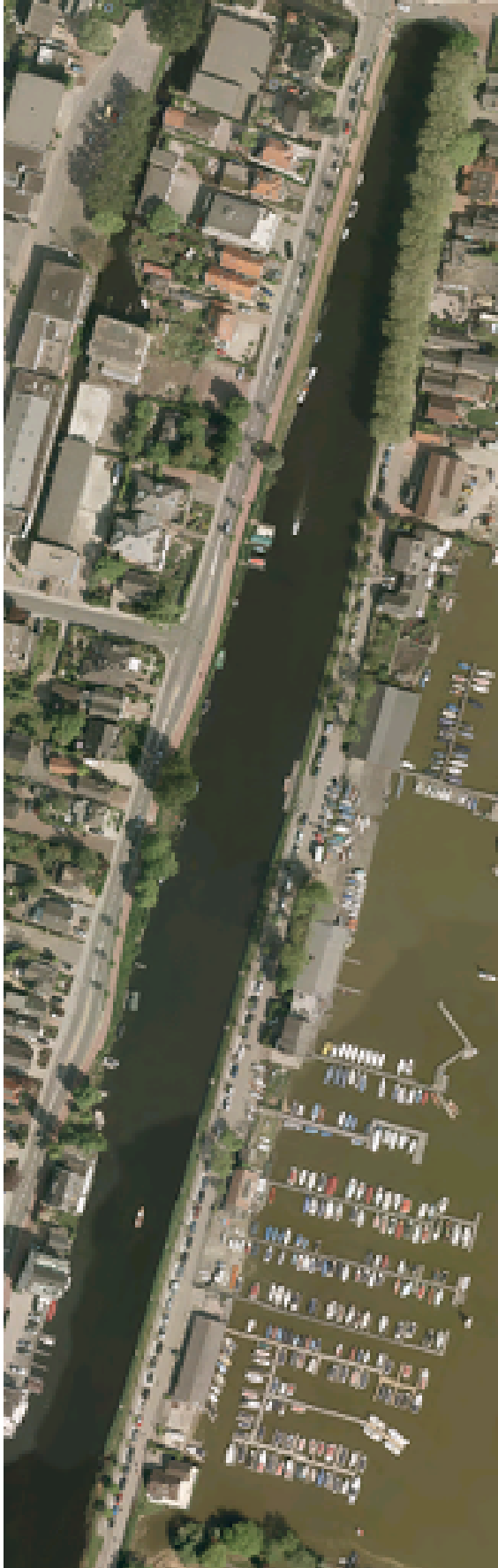
Figuur 4 Luchtfoto Notaris d'Amerielaan