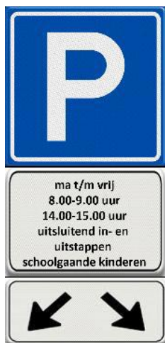
E4 met gewijzigd onderbord