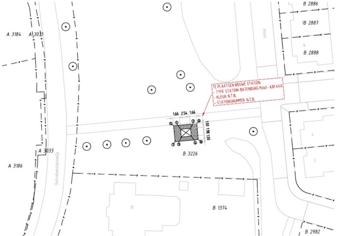
Situatie 4 nabij Statio, Poortugaal :