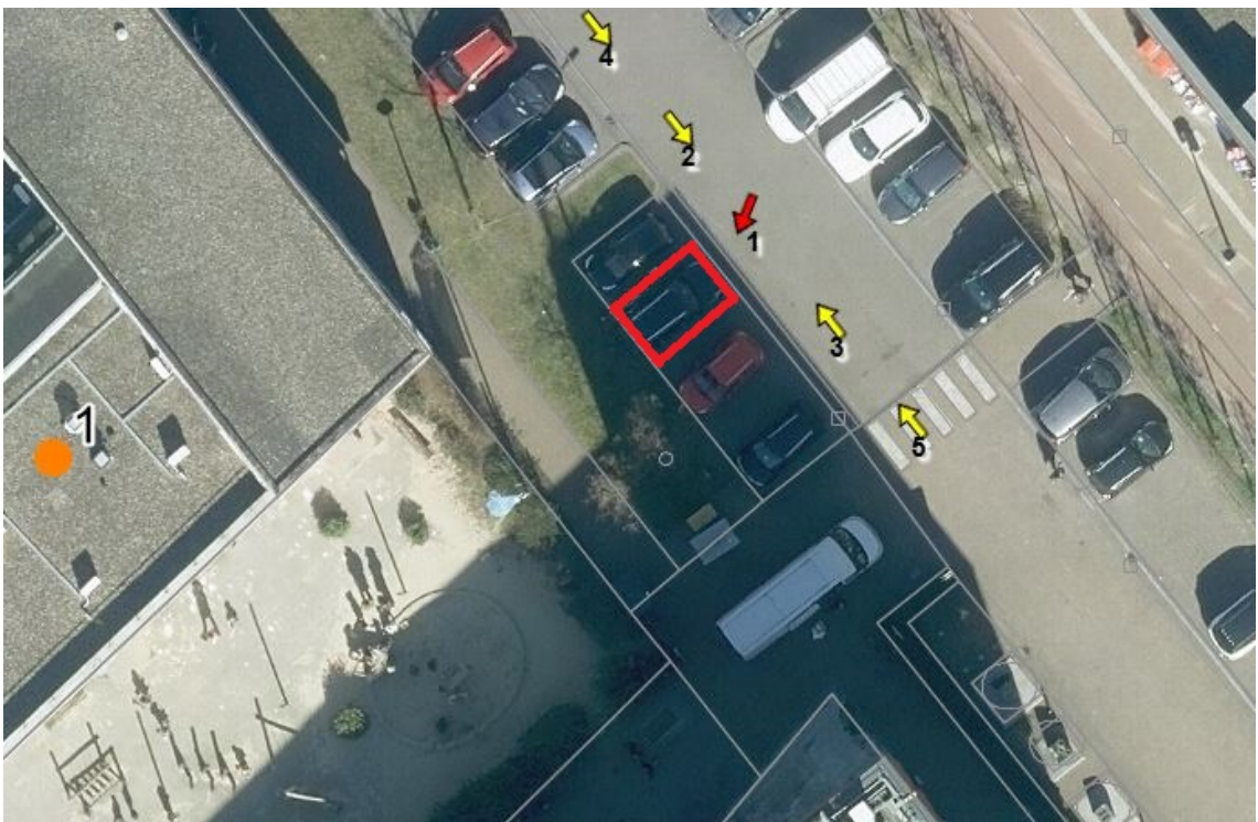
Luchtfoto van locatie aangewezen voor een gehandicaptenparkeerplaats

Burgemeester en wethouders van Hendrik-Ido-Ambacht, 15 september 2025