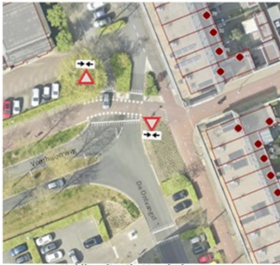
Huidige situatie Veenhuizerweg