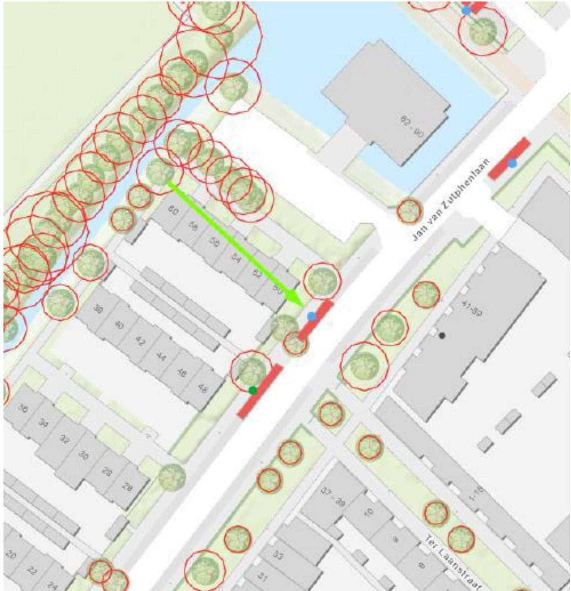
Afbeelding locatie en kadastrale kaart