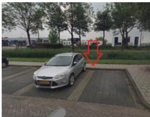
Prins Hendrikstraat, in de haakse parkeervakken tegenover de woning met huisnummer 7 te Willemstad;