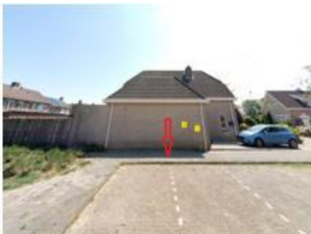
Het Weeltje, in de haakse parkeervakken naast de woning met huisnummer 1 te Noordhoek;