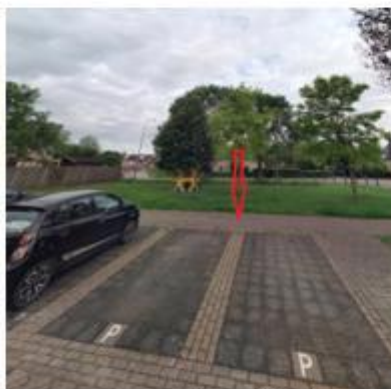
Slotdreef, in de haakse parkeervakken tegenover de woning met huisnummer 1 te Willemstad;