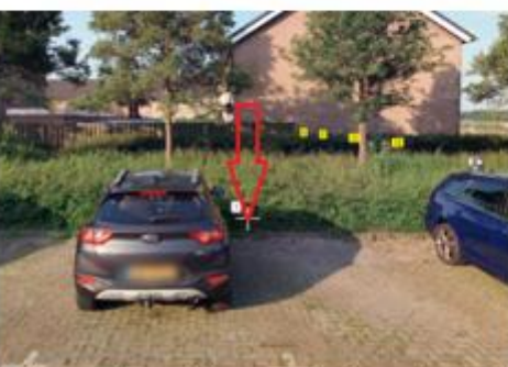
Doctor Jan van den Tempellaan, in de haakse parkeervakken naast de woning met huisnummer 12 te Willemstad;