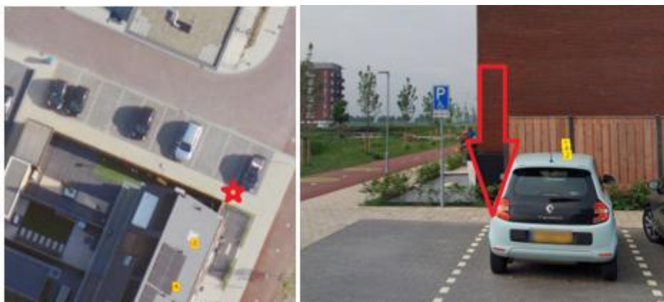
Sodaliet, in de haakse parkeervakken naar de woning in de Pyriet met huisnummer 2 te Zevenbergen;