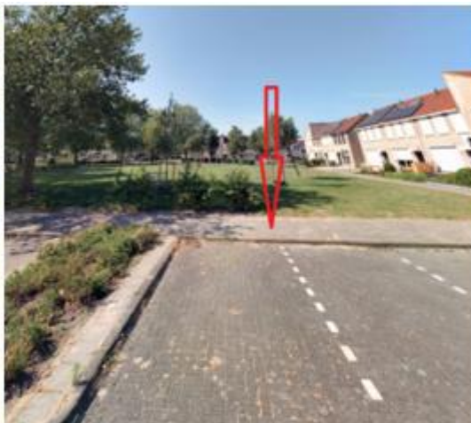
Perzikkruid, in de haakse parkeervakken tegenover de woning met huisnummer 7 te Zevenbergen;