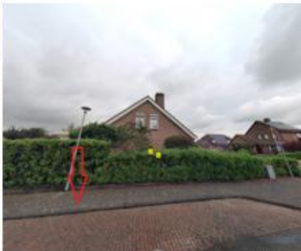
Koperwiekstraat, in de langsparkeervakken naast de woning in de Torenvalkstraat met huisnummer 8 te Fijnaart;