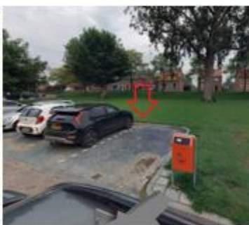
Bisschop Hopmansstraat, in de haakse parkeervakken tegenover de woning met huisnummer 9 te Noordhoek;