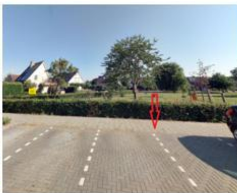
De Zwingelspaan, in de haakse parkeervakken tegenover de woning met huisnummer 2 te Zevenbergen;