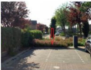
De Kreeck, in de haakse parkeervakken naast de woning in Het Ravelijn met huisnummer 12 te Klundert;