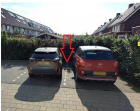
Malachiet, in de haakse parkeervakken naast de woning in de Opaal met huisnummer 1 te Zevenbergen;