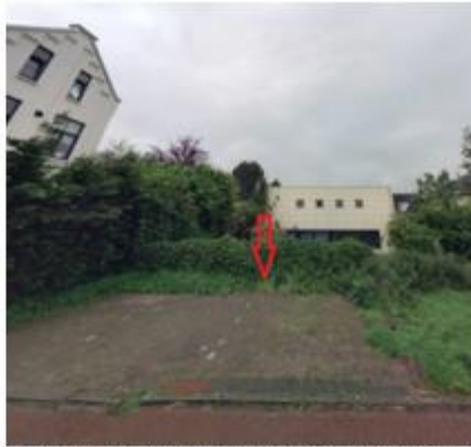
Huizersdijk, in de haakse parkeervakken naast de woning met huisnummer 28 te Zevenbergen;