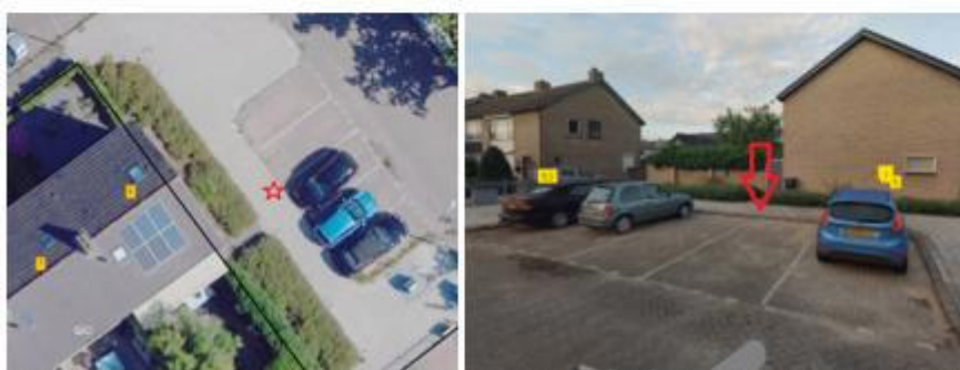
De Wieken, in de haakse parkeervakken naast de woning met huisnummer 5 te Zevenbergschen Hoek; Aldus besloten te Zevenbergen, 16-05-2025

Namens burgemeester en wethouders van de gemeente Moerdijk,