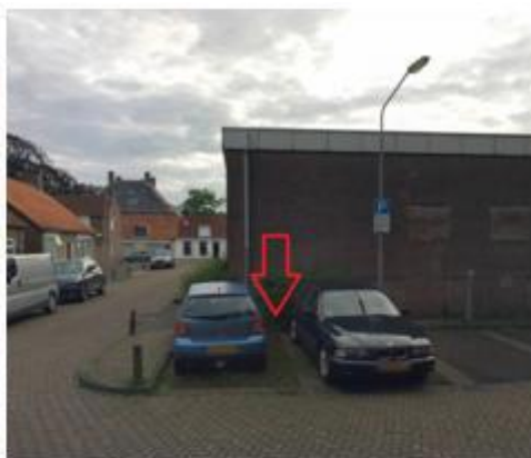
Grimhoek, in de haakse parkeervakken tegenover de woning met huisnummer 6 te Willemstad;