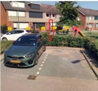
Annendal, in de haakse parkeervakken tegenover de woning met huisnummer 30 te Zevenbergen;