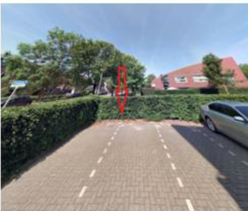
Lindonk, in de haakse parkeervakken tegenover de woning met huisnummer 89 E te Zevenbergen;