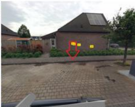
Leeuwerikstraat, in de haakse parkeervakken naast de woning met huisnummer 39 te Fijnaart;