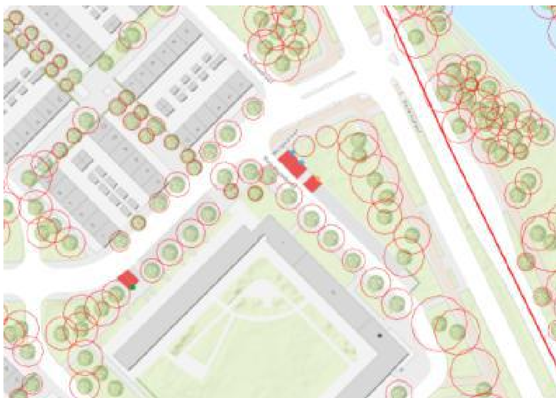
Afbeelding locatie en kadastrale kaart