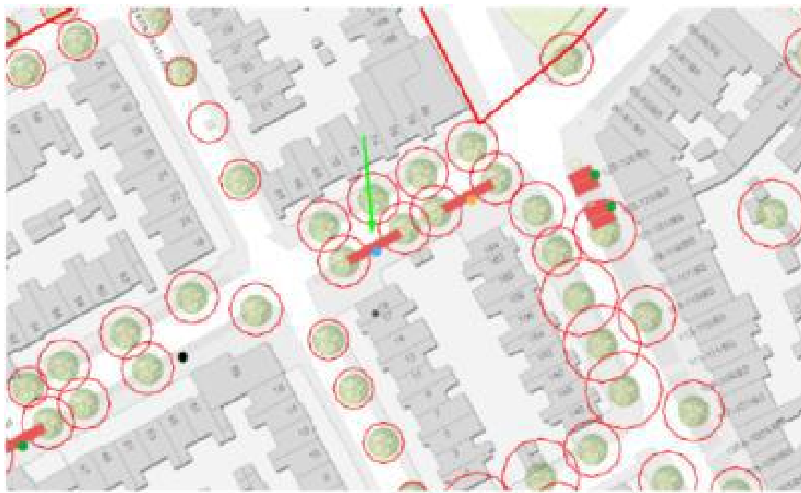
Afbeelding locatie en kadastrale kaart