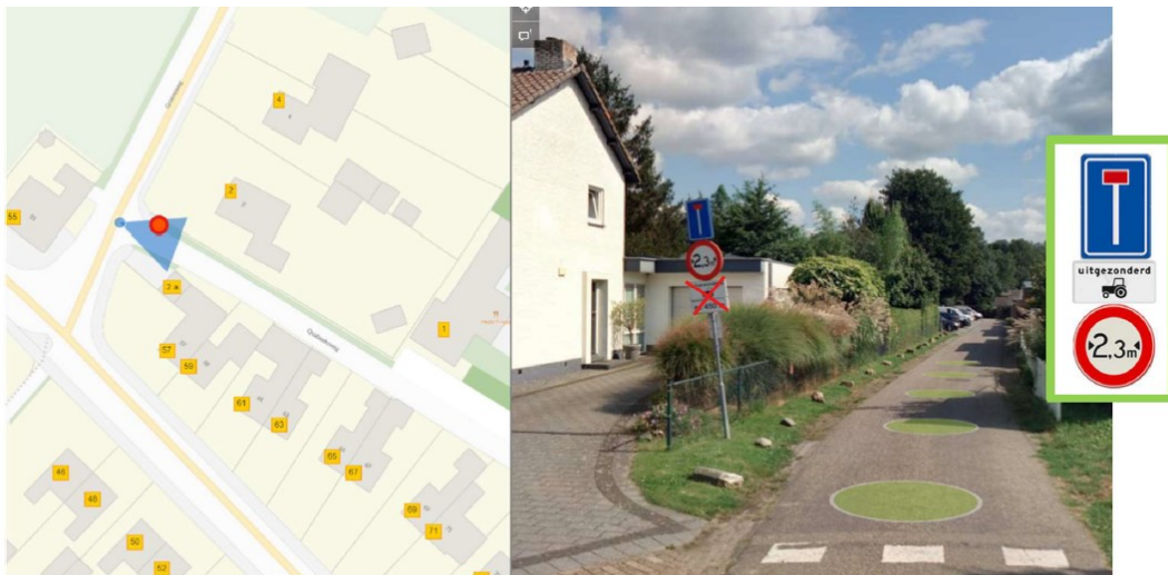
Figuur 4, Quabeeksweg vanaf de Groeneweg – Verplaatsen onderborden OB55 en vooraankondiging naar boven als onderbord bij L8 “Doodlopende weg”.