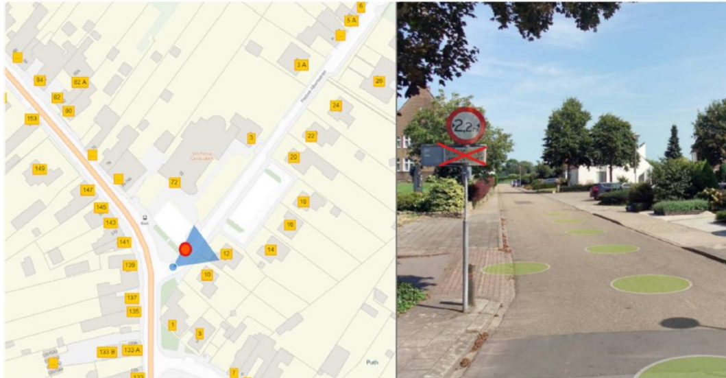
Figuur 1, Pastoor Albertsstraat te Puth – Verwijderen onderbord “uitgezonderd landbouwverkeer”