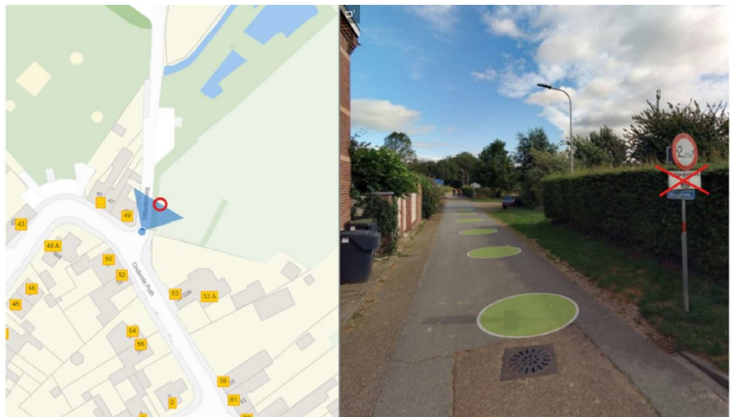
Figuur 2, Sittarderweg te Puth – Verwijderen onderbord OB55 “uitgezonderd tractoren”