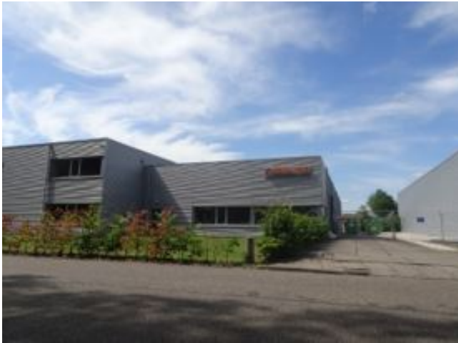
leegstaand kantoorgedeelte, achterliggende bedrijfshal in gebruik

Ondernemingen verdwijnen en ontstaan. Het soort onderneming dat zich vestigt op een bedrijventerrein verandert ook door de tijd heen. Een trend die op sommige plekken zichtbaar is bestaat uit ondernemingen die geen behoefte meer hebben aan kantoorruimte, maar wel aan opslag/logistiek. Hierdoor kan het voorkomen dat de voorzijde van een bedrijfsgebouw verlaten is en leegstand uitstraalt. Uit economisch perspectief zou je als gemeente mogelijkheden willen bieden om hier iets aan te doen. Het probleem is tegelijkertijd dat dit complex is. Wat sta je toe en hoe behouden we een goede ruimtelijke ordening?