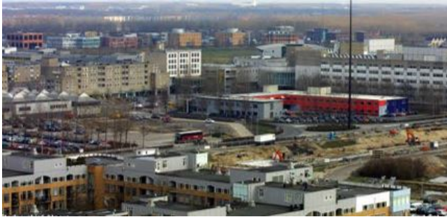
Afbeelding: Uitzicht op het Stadhuisplein in 2001 4

In de afgelopen decennia is er veel veranderd in het centrum van de stad. In 2001 bestond het huidige 'nieuwe stadshart nog niet'. En op de locatie van het huidige circus stond een gebouw dat wel echt leek op een soort circustent.