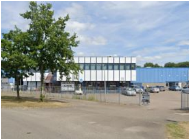
Wel of geen detailhandel?

In het verlengde hiervan is het wel/niet toestaan van detailhandel een vraagstuk van alle tijden. Ook tijdens ons bezoek aan de Vaart 1 komt dit ter sprake. Op bedrijventerreinen is opslag van goederen in het algemeen toegestaan. Maar verkoop in de vorm van detailhandel niet. Daartussen is een groot grijs gebied. Denk bijvoorbeeld aan een bedrijf dat inboedels opkoopt en eens per week een veiling organiseert. Het gegeven is een vraagstuk, maar dit wordt des te complexer wanneer de gemeentelijke handhaving jarenlang niet aanwezig is en afweert van het vraagstuk, terwijl de gemeente vanuit economische zaken en beheer (o.a. de afdeling Stadsruimte) wel frequent rondloopt op hetzelfde bedrijventerrein.