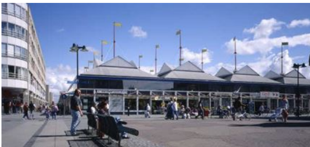
Afbeelding: Voormalig Winkelcentrum het circus (foto uit 1993) aan de grote Markt 5 .

In de afgelopen decennia is er veel veranderd in het centrum van de stad. In 2001 bestond het huidige 'nieuwe stadshart nog niet'. En op de locatie van het huidige circus stond een gebouw dat wel echt leek op een soort circustent.