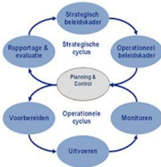
Figuur 1: Big 8 Cyclus

Om ervoor te zorgen dat de uitvoering van onze taken op het gebied van vergunningen, handhaving en toezicht op een gestructureerde manier wordt geborgd, maken we gebruik van een landelijke beleidscyclus genaamd de "BIG 8" (zie figuur 1). Deze beleidscyclus verbindt beleid en uitvoering, waarbij het evaluatieonderdeel ervoor zorgt dat ons beleid altijd aansluit op de uitvoering in de praktijk.