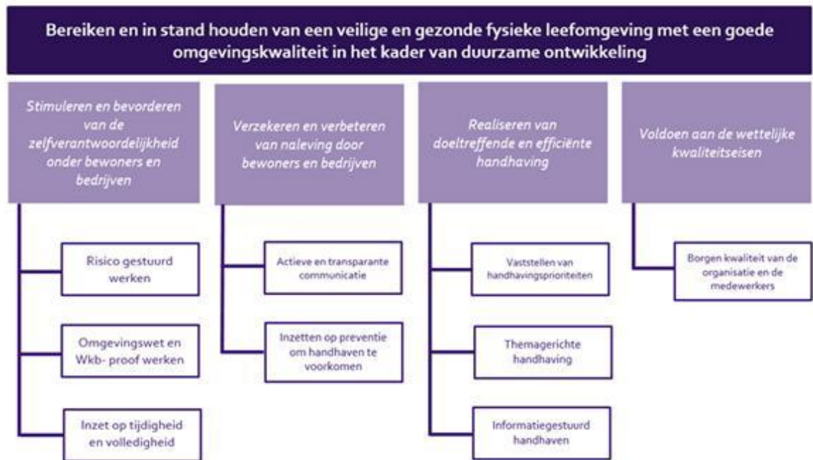
Figuur 2: Doelstellingen U&H-strategie 2024-2027