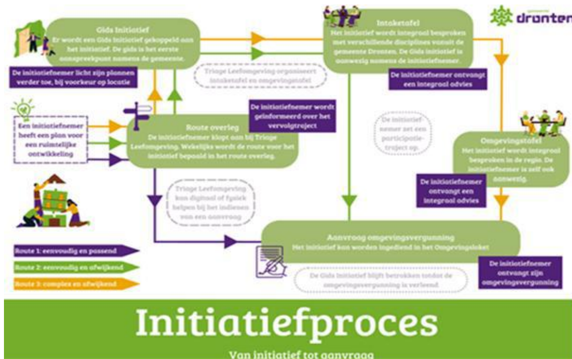
Figuur 3: Initiatiefproces

Bij complexe aanvragen wordt verwacht dat het proces niet binnen acht weken kan worden afgerond. Het streven is om het vooroverleg te laten plaatsvinden via de Omgevingstafel voordat de officiële vergunningsaanvraag wordt ingediend en voordat de officiële verwerkingstermijn van acht weken begint. Tijdens de bijeenkomsten aan de Omgevingstafel, die één of meerdere sessies kunnen omvatten, komen de initiatiefnemer en de adviseurs van de gemeente samen. Het initiatief wordt besproken met als uitgangspunt om het mogelijk te maken. De gemeente en ketenpartners kunnen bestuurlijke prioriteiten en randvoorwaarden, zoals de energietransitie (energiebesparing en -opwekking), bespreken. De Omgevingstafel voorziet de initiatiefnemer van een integraal advies, dat hem in staat stelt de vergunningaanvraag op te stellen en in te dienen. Vervolgens kan de aanvraag binnen acht weken worden verwerkt. In de onderstaande afbeelding is dit proces schematisch weergegeven.