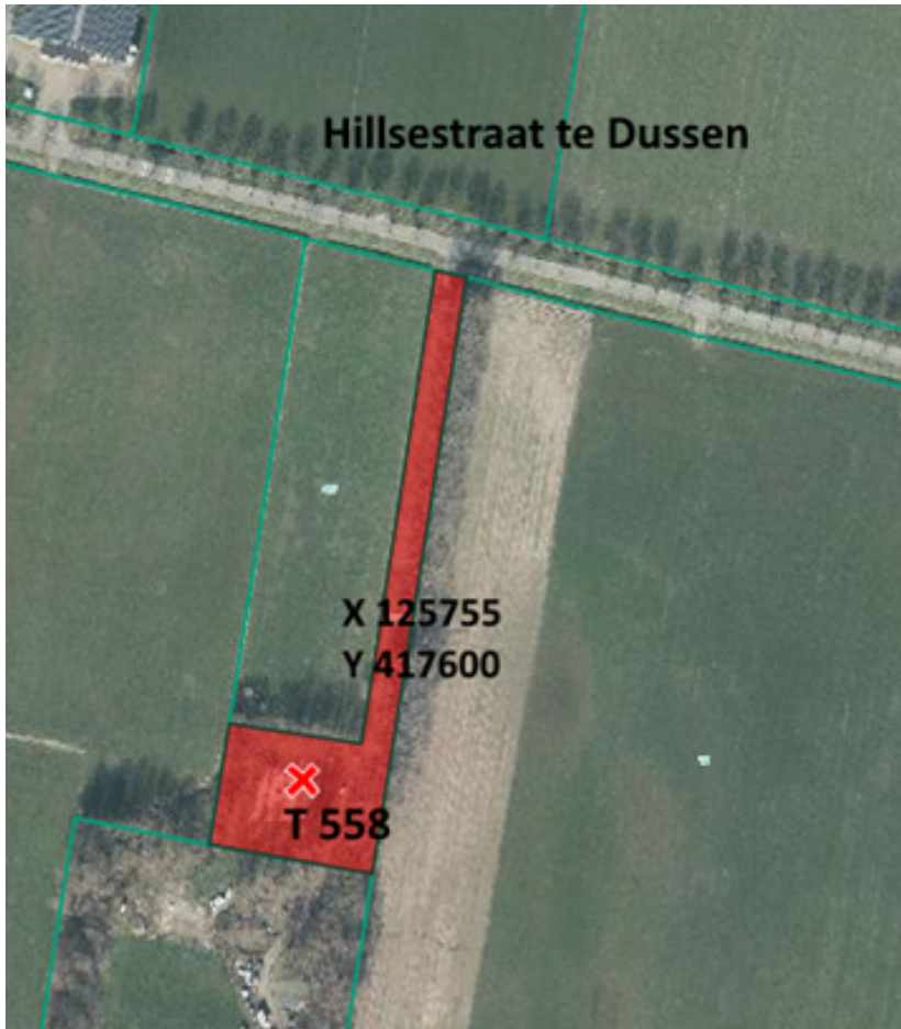
D. Risicokaart OO