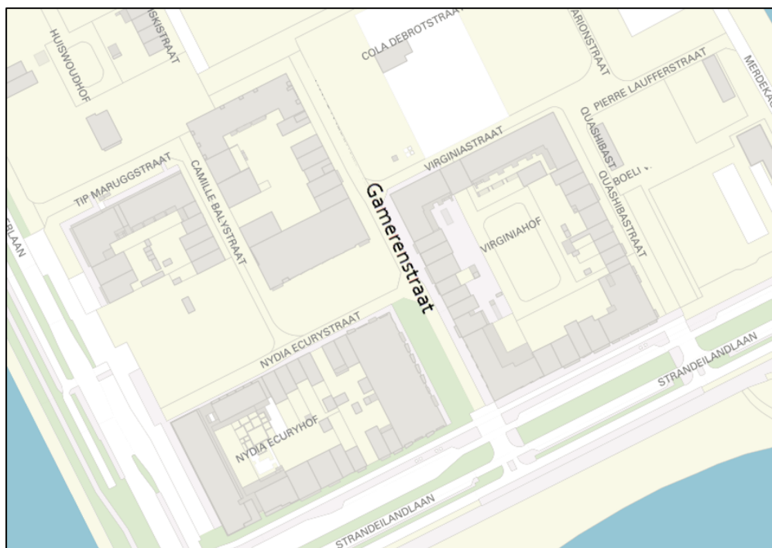
De nieuwe situatie in stadsdeel Oost