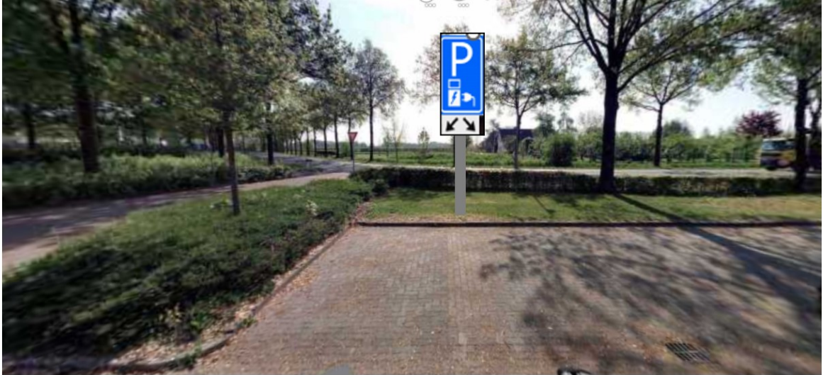
Groeneweg 32, 4197 HG Buurmalsen