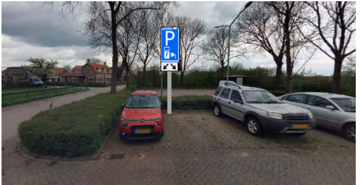
Kersendreef 15, 4147 HC Asperen