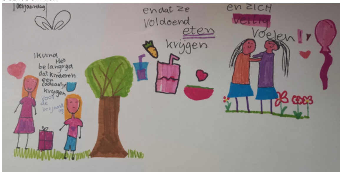
Figuur 1: Tekening van een lid van het kinderpaleis

In bijlage 3 zijn teksten opgenomen uit deze kaders. De teksten zijn letterlijk overgenomen uit de bestaande stukken.