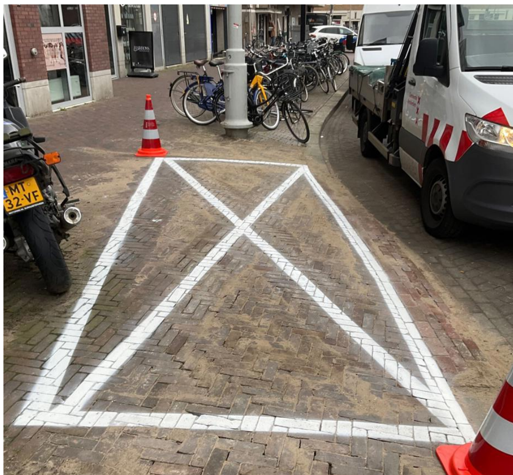
Amsterdam, 7 februari 2024