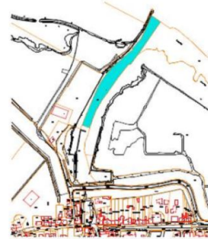
Haven Den Bommel

Behoort bij besluit van de gemeenteraad van Goeree-Overflakkee dd. nr.