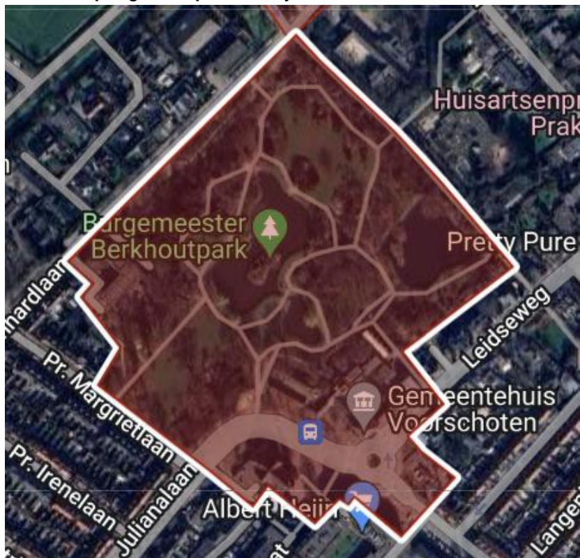
Zone 4: Woonzorgcentrum Foreschate