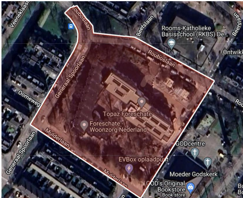
Zone 5: Huize Bijdorp