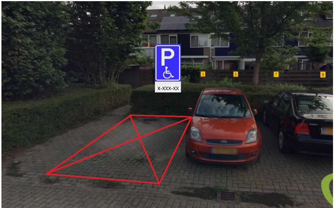
Afbeeldingen behorende bij verkeersbesluit met kenmerk 1404768 d.d. 18-12-2024 Aldus besloten te Zevenbergen, 18-12-2024

Namens burgemeester en wethouders van de gemeente Moerdijk,