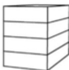
P4 - Flat 4-laags plat