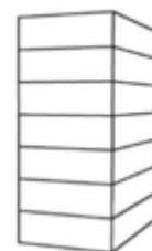
P7 - Flat 7-laags plat