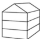
UV3 - Urban villa 3-laags met zadeldak