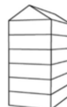
UV6 - Urban villa 6-laags met zadeldak