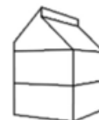
S4 - Woning 3-laags verspringend lessenaarsdak