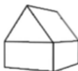
K2 - Woning 2-laags zadeldak