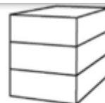
P3 - Woning 3-laags plat dak