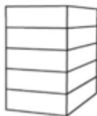
P5 - Flat 5-laags plat