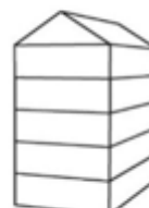
UV5 - Urban villa 5-laags met zadeldak