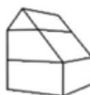
S3 - Woning 3-laags mank dak