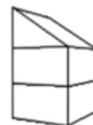
H3 - Woning 3-laags lessenaarsdak