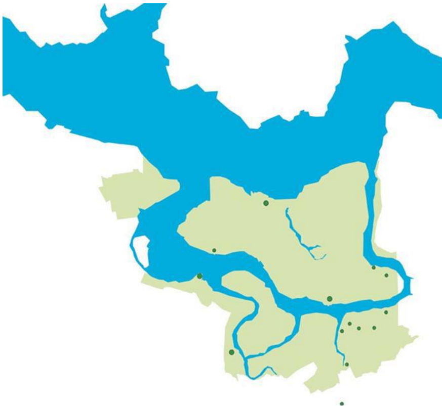
Forten en krekens