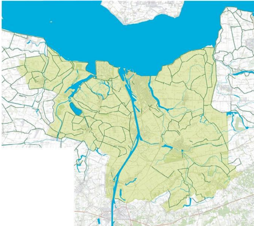
Water en dijken