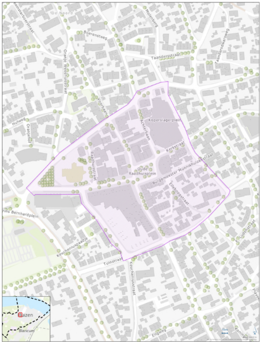
Beleidskader handhaving art. 2:1 APV Huizen [Oude Dorp]