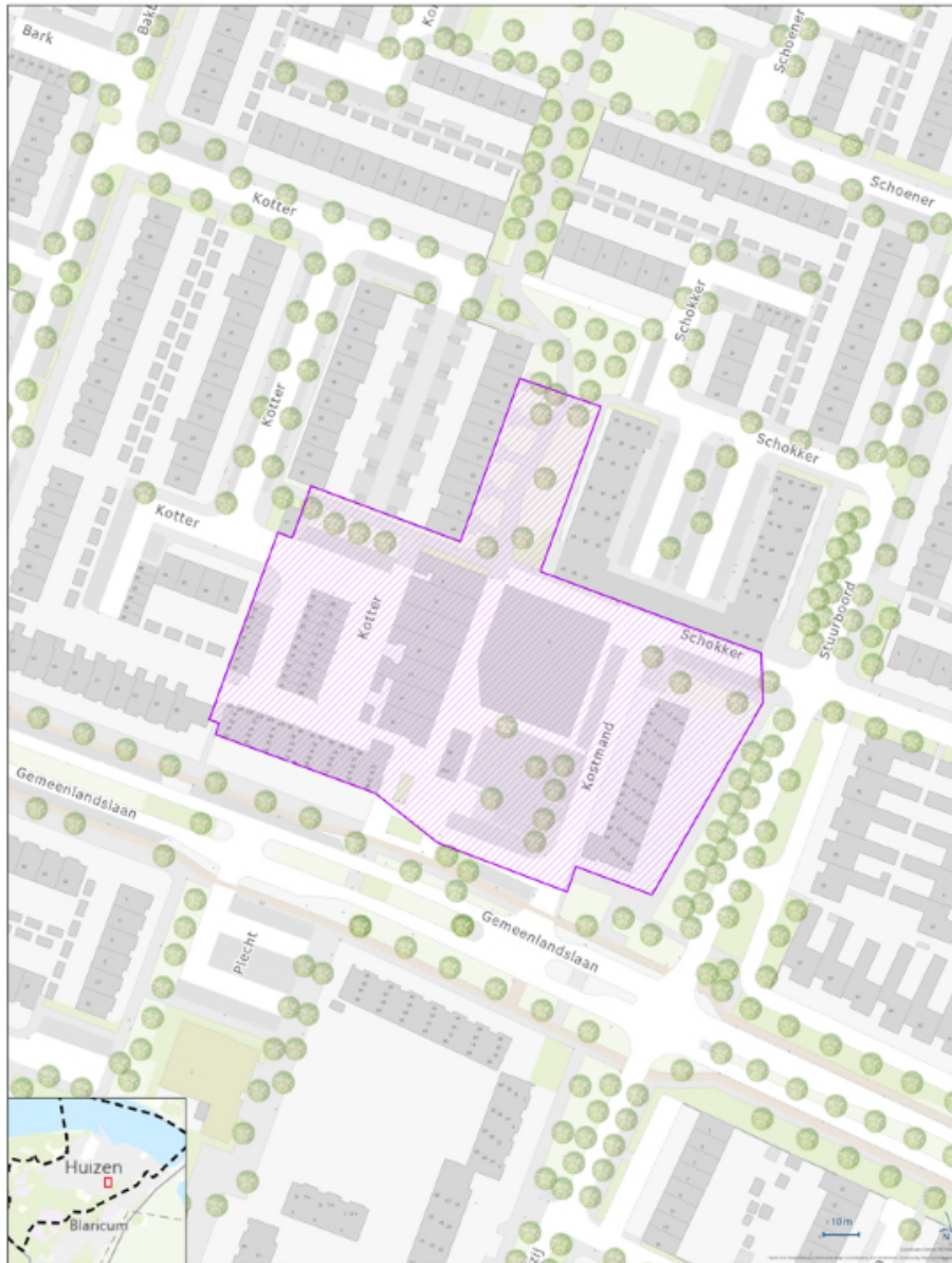
Beleidskader handhaving art. 2:1 APV Huizen [Kostmand]

Legenda [Purple hatched box] Beleidskader handhaving art. 2:1 APV Huizen