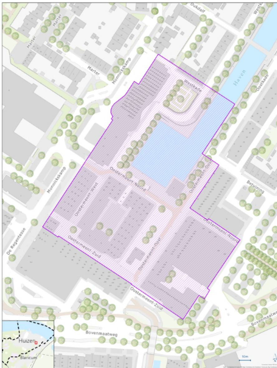
Beleidskader handhaving art. 2:1 APV Huizen [Oostermeent]