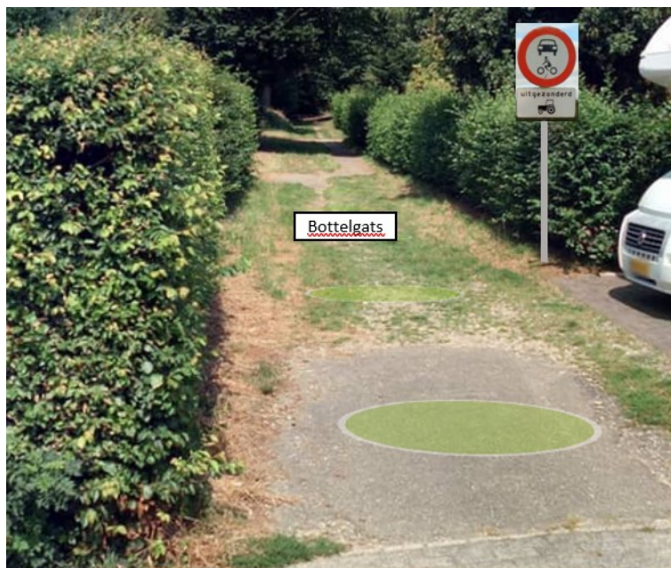
Figuur 4: Locatie 5 - Bottelgats Bord C12 bijplaatsen