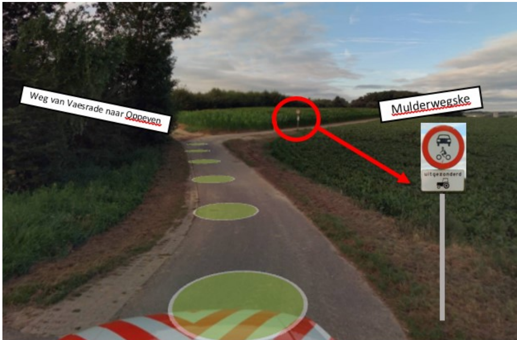
Figuur 2: Locatie 3 - Verplaatsen C12 naar inrit aan de Hommerterweg