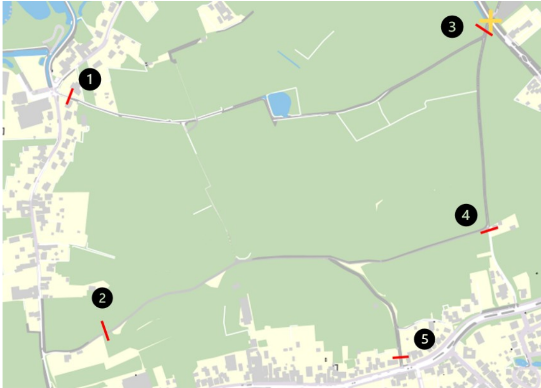
Figuur 1: Landbouwgebied met de gewenste afsluitingen in rood