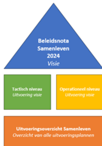
Figuur 1: Beleidshuis

Vanzelfsprekend zijn we er niet met alleen een concrete overkoepelende visie, ambitieuze uitgangspunten, een duidelijk kader en een richting voor de toekomst. Elk jaar presenteren we een uitvoeringsoverzicht waarin alle projecten staan beschreven die we uitvoeren op tactisch en operationeel niveau. Dit uitvoeringsoverzicht evalueren we jaarlijks om met elkaar scherp te houden dat alles wat we doen zoveel mogelijk bijdraagt aan de realisatie van onze uitgangspunten. Hierdoor ontstaat een dynamisch proces waarin we constant blijven werken aan de realisatie van onze uitgangspunten en kunnen we ons aanpassen aan de vraag van de samenleving. In figuur 1 wordt dit schematisch weergegeven.