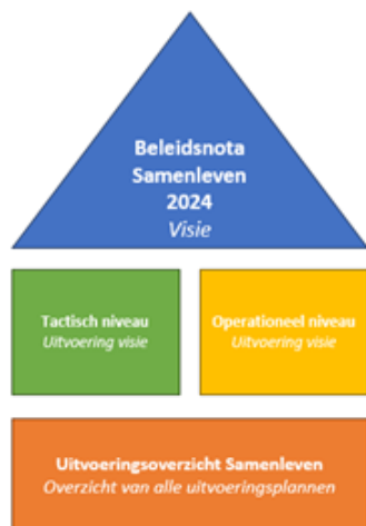
Figuur 3: Beleidshuis

We richten ons op wat onze inwoners wél kunnen en ondersteunen hen waar nodig. Om uitvoering te kunnen geven aan onze visie, maken we een vertaling naar tactisch en operationeel niveau. Daarin staat aangegeven hoe de uitgangspunten vertaald worden naar de praktijk. De projectplannen worden jaarlijks gebundeld in een uitvoeringsoverzicht. In de figuur hieronder is nogmaals weergegeven hoe deze diverse stukken zich tot elkaar verhouden.