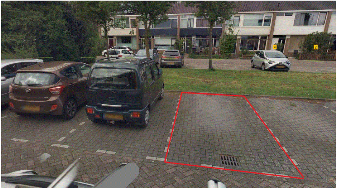
Foto van locatie aangewezen voor een gehandicaptenparkeerplaats