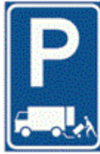
RVV-bord E07 Doelgroepvak Laden en lossen