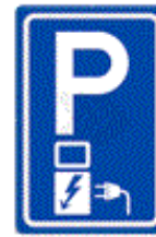
RVV-bord E08 Doelgroepvak Laden elektrisch voertuig