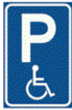
RVV-bord E06 Doelgroepvak Gehandicapten

Te plaatsen, of te verplaatsen bebording doelgroepvakken