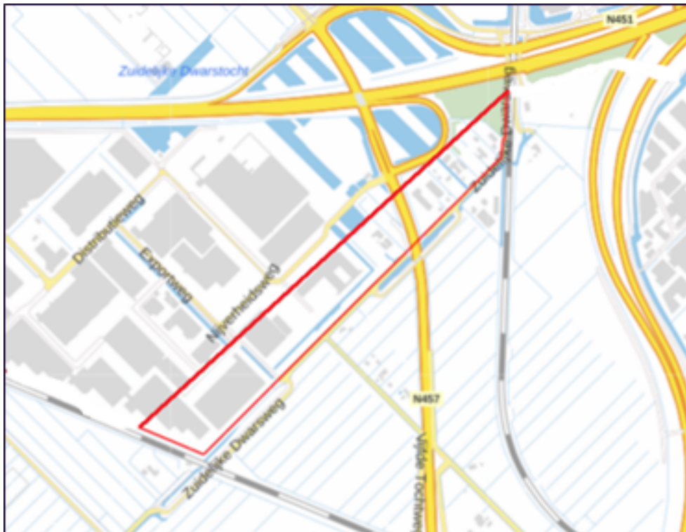
Afbeelding 1: Woningen en/of gebouwen binnen grondgebied Waddinxveen (rode lijn)