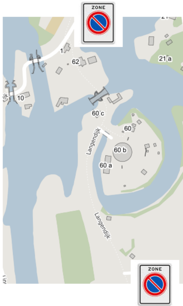
Langedijk Acquoy, parkeerverbod zone