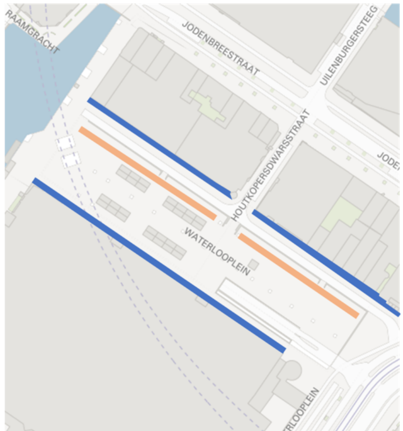
Afbeelding 1: situatietekening Waterloo plein