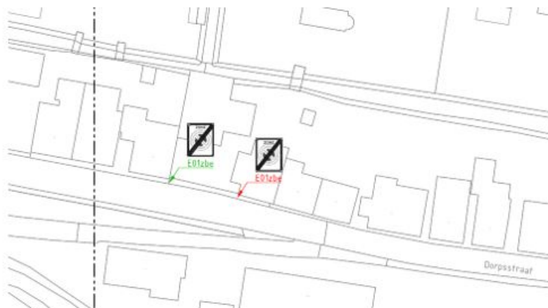
Wijziging van de parkeerverbod zone rondom de Dorpsstraat (ter hoogte van huisnummer 114). Groen is aan te brengen bebording, rood is te verwijderen bebording.