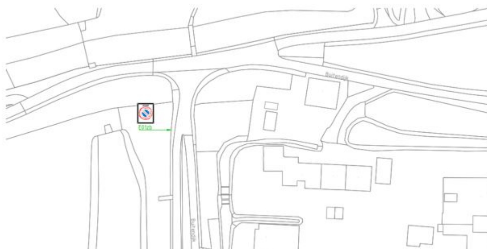
Wijziging van de parkeerverbod zone rondom de Buitendijk (ter hoogte van het kruispunt Buitendijk – Zalmpad ). Groen is aan te brengen bebording, rood is te verwijderen bebording.